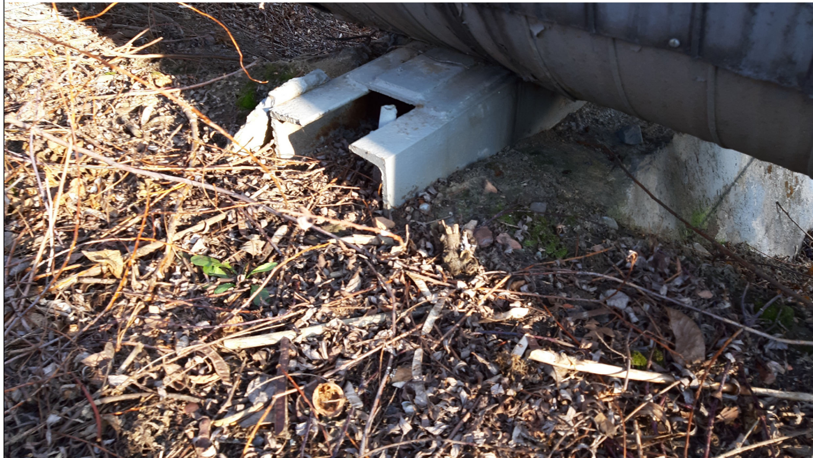
PODPORA ŚLIZGOWA P-116