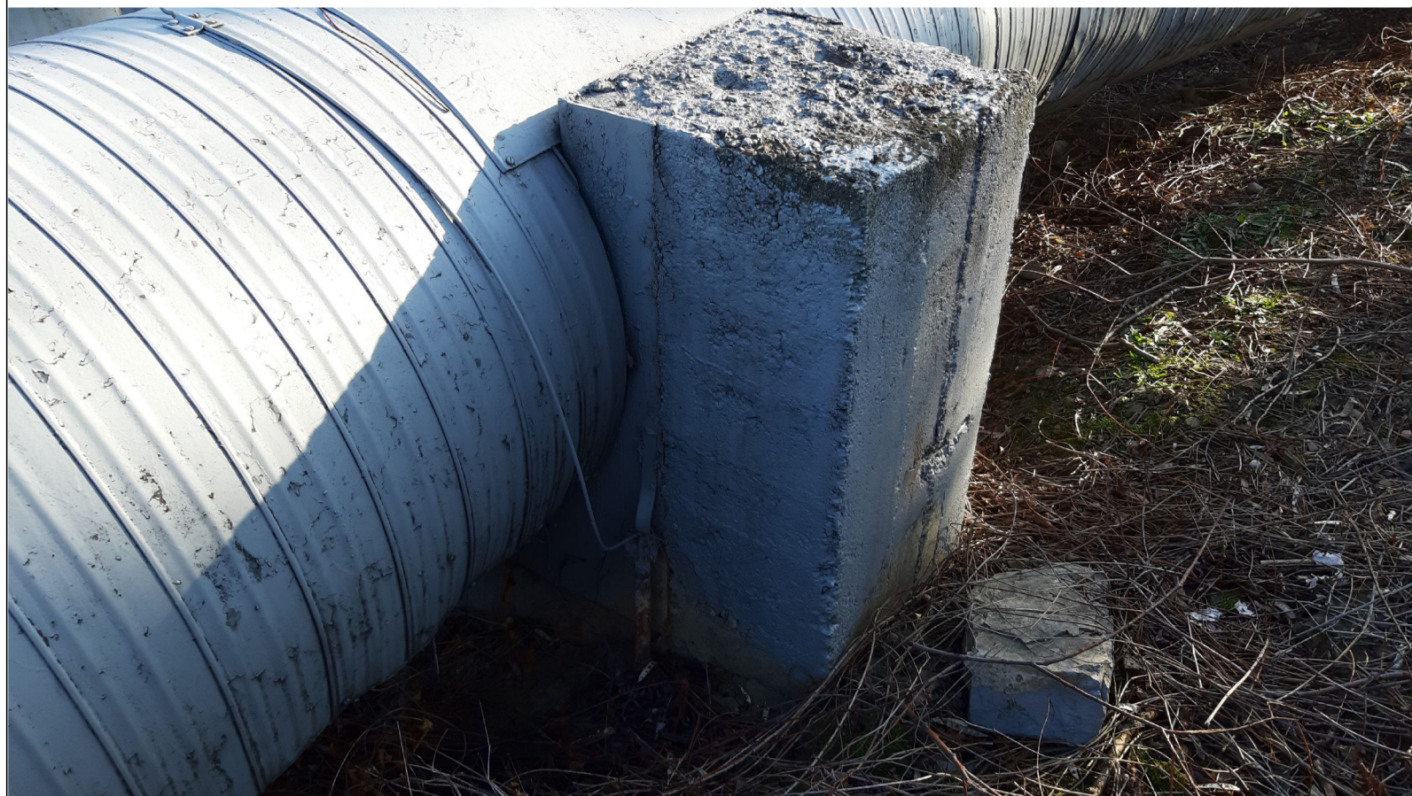
PUNKT STAŁY PS-21