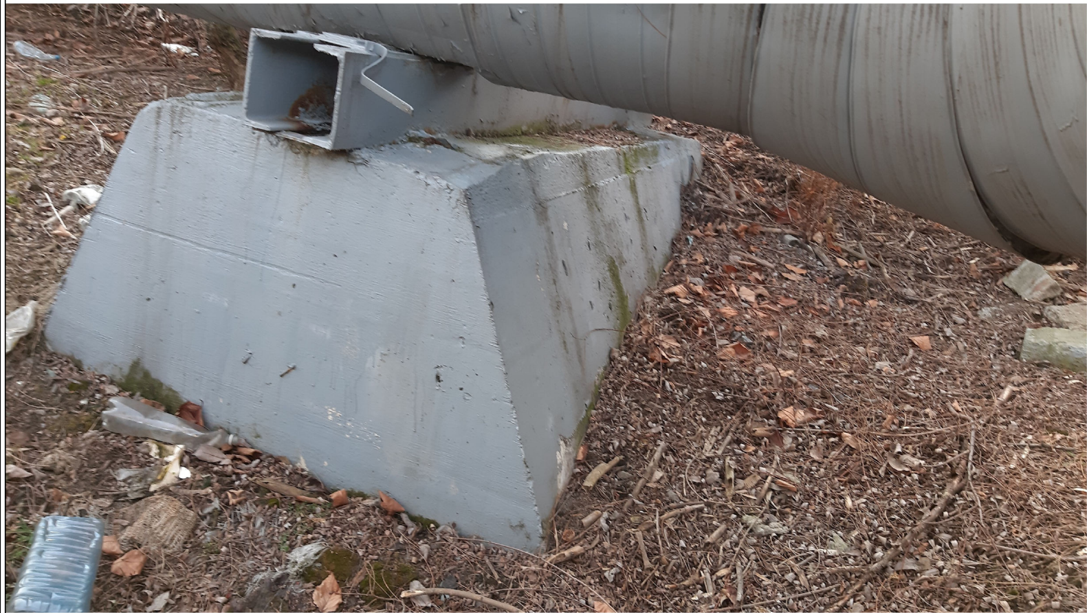
PODPORA ŚLIZGOWA P-109