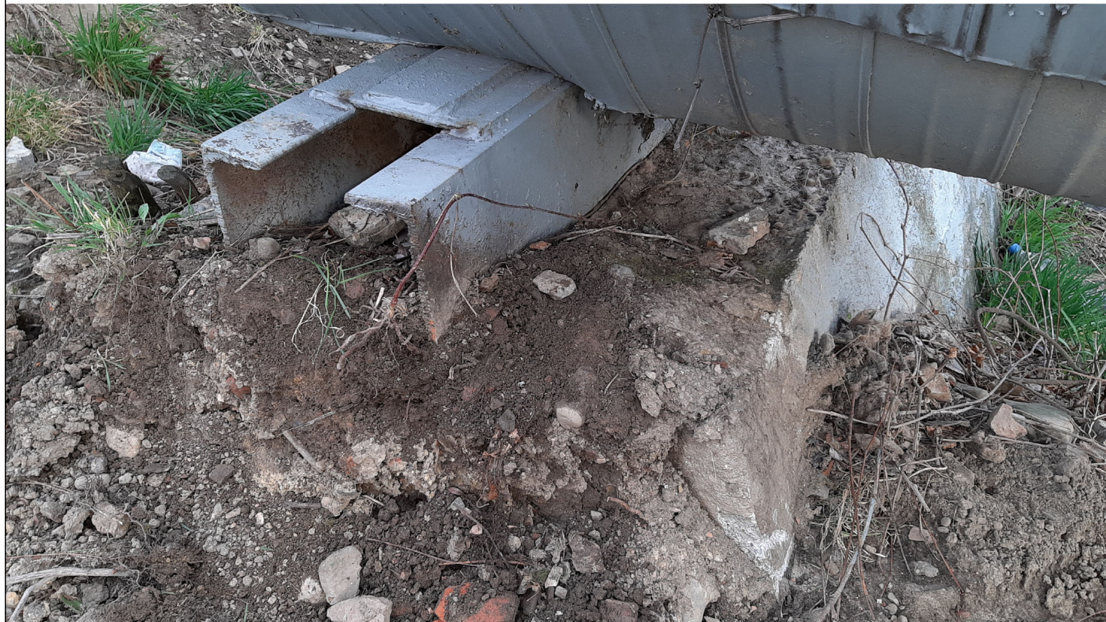
PODPORA ŚLIZGOWA P-114