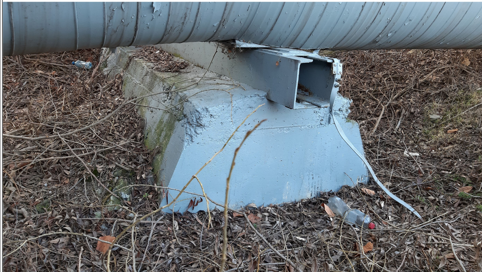
PODPORA ŚLIZGOWA P-106