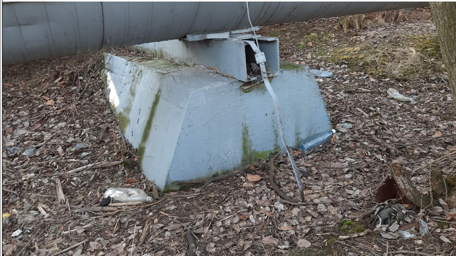
PODPORA ŚLIZGOWA P-110