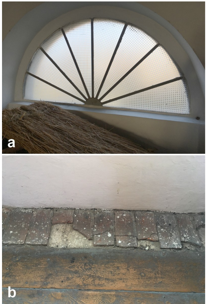
Fot. 15. a) Wykonana w II połowie XX wieku wtórna stolarka okienna środkowej kondygnacji empor b) Wyrównanie poziomu wcięcia w murze pod oknem za pomocą dachówek