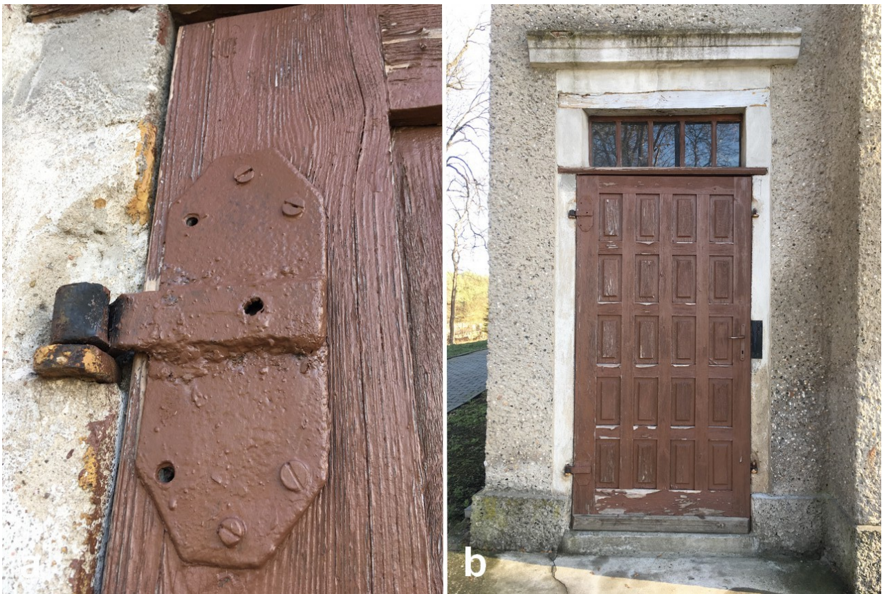
Fot. 11. Drzwi wejściowe na empore wstawione w II połowie XX wieku