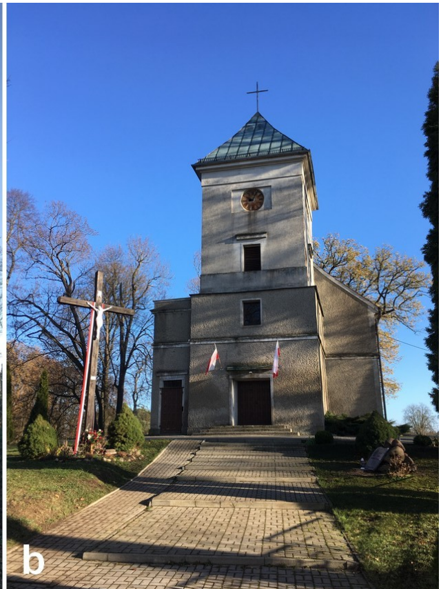
Fot. 2. Jak wyżej, a) Elewacja północna, b) elewacja zachodnia