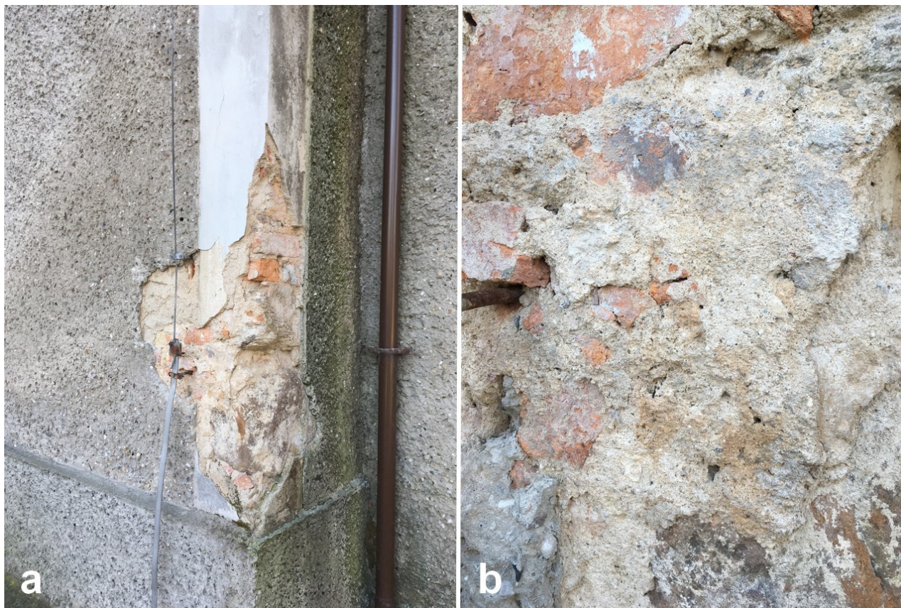
Fot. 5. Odkrywka nr 1, narożnik północno-zachodni korpusu, widoczna pod wtórnym tynkiem najstarsza, spieczona pożarem warstwa zaprawy wapienno-piaskowej