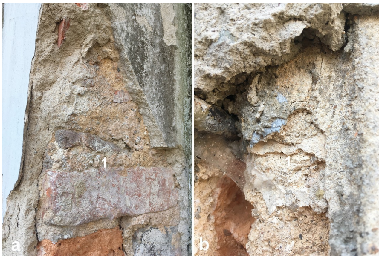
Fot. 6. Odkrywka jak wyżej, a) opracowanie fugi, b) zaprawa z reliktem pobiałą