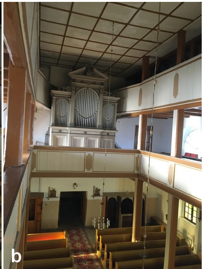
Fot. 4. Wnętrze kościoła, widok ogólny