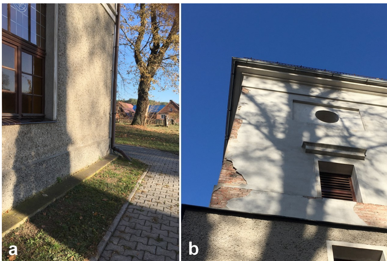
Fot. 10. a) Opaska betonowa wokół murów kościoła; b) Zachowany z I połowy XX wieku wystrój elewacji wieży