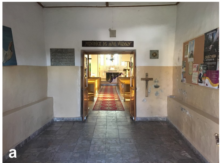
Fot. 3. Kruchta zachodnia