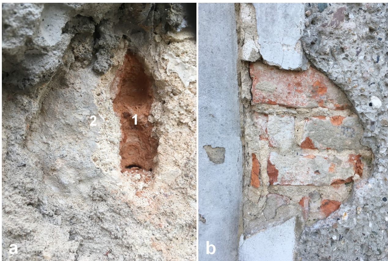
Fot. 7. a) Odkrywka nr 1, fragment, widoczna pobiała na zaprawie; b) Odkrywka nr 2, przy zamurowanym otworze wejściowym w elewacji północnej, widoczny wątek ceglany z jasną zaprawą wapienno-piaskową o zróżnicowanym uziarnieniu wypełniacza, ciemniejsza szara zaprawa modyfikowana hydraulicznie na opasce oraz cementowa zaprawa fakturalna po prawej, na płaszczyźnie ściany