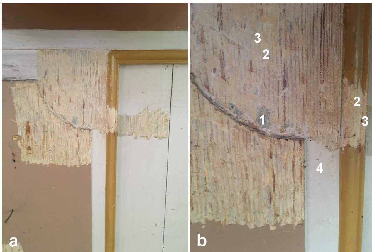
Fot. 19. Odkrywka nr 7 na balustradzie dolnego poziomu empor, część zachodnia: 1, 2 – relikty niebieskiej dekoracji na szarym tle, 1817, 3 – żółte przemalowanie, II poł. XX. w., 4 – obecne przemalowanie