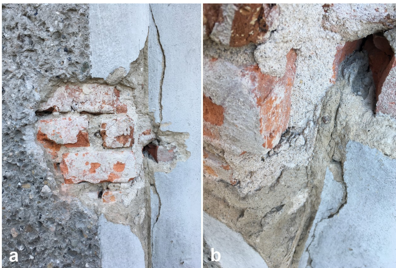
Fot. 8. Odkrywka nr 3 Otwór wejściowy jak wyżej, strona lewa, analogiczne nawarstwienia