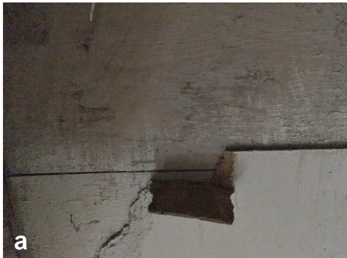
Fot. 17. a) Fragment stropu kościoła z widoczną szarawą w odcieniu pobiałą b) Pobiała wapienna na stropie empory 1 – pobiała, 1817 ? 2 – pobiała, XIX w. 3 – obecne przemalowanie