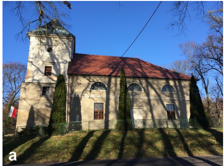
Fot. 1. a) Elewacja południowa kościoła w Drzonowie b) Elewacje wschodnia i północna