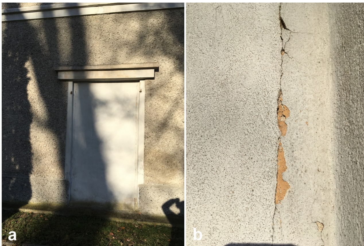
Fot. 9. Zamurowany otwór drzwiowy po stronie południowej, widok ogólny. Na styku zamurowania otworu i glifu stwierdzono zachowaną w tym miejscu pomarańczową warstwę malarską położoną na opracowaniu tynkarskim z I połowy XX wieku