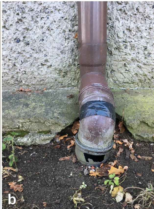
Fot. 14. a) Odkrywka nr 5, 1 – mur ceglany, 1817, 2-3 - tynk wapienno-piaskowy w dwóch różnobarwnych warstwach, 1817, 4 – pobiału wapienna, 1817, 5 – naprawa tynkarska z białym przemalowaniem, II poł XX w., 6 – obecne przemalowanie; b) Stan techniczny rur spustowych