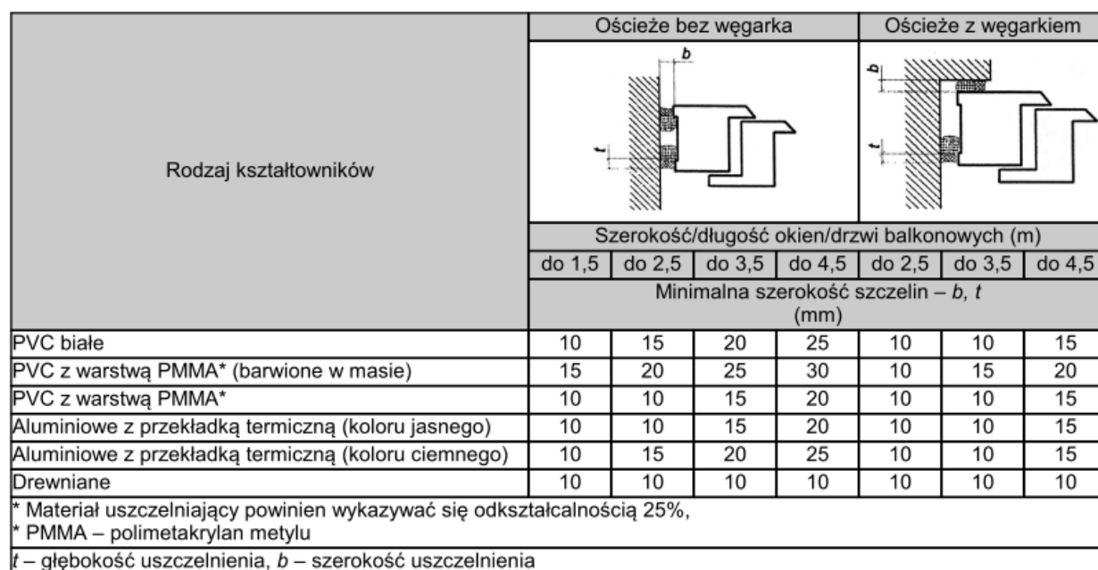
Tablica 3. Minimalna szerokość szczelin między ramą ościeżnicy a ościeżem przy uszczelnieniach kitami elastycznymi*

Przy wykonywaniu uszczelnień z kitów trwale elastycznych należy przestrzegać zasady, że głębokość warstwy uszczelnienia t powinna odpowiadać co najmniej połowie szerokości szczeliny b i wynosić nie mniej niż 6 mm.