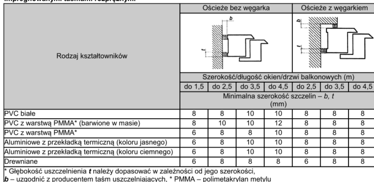
Tablica 4. Minimalna szerokość szczelin między ramą ościeżnicy a ościeżem przy uszczelnieniach impregnowanymi taśmami rozprężnymi*

Maksymalny wymiar szczeliny między ościeżnicą okienną a ościeżem nie powinien przekraczać 40 mm. Przy stosowaniu pianek jednoskładnikowych wymiar ten powinien wynosić maksymalnie 30 mm.