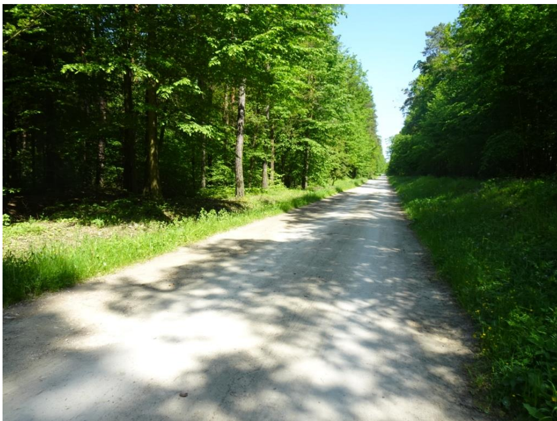
10. Szczegół koleiny z rozluźnionym kruszywem