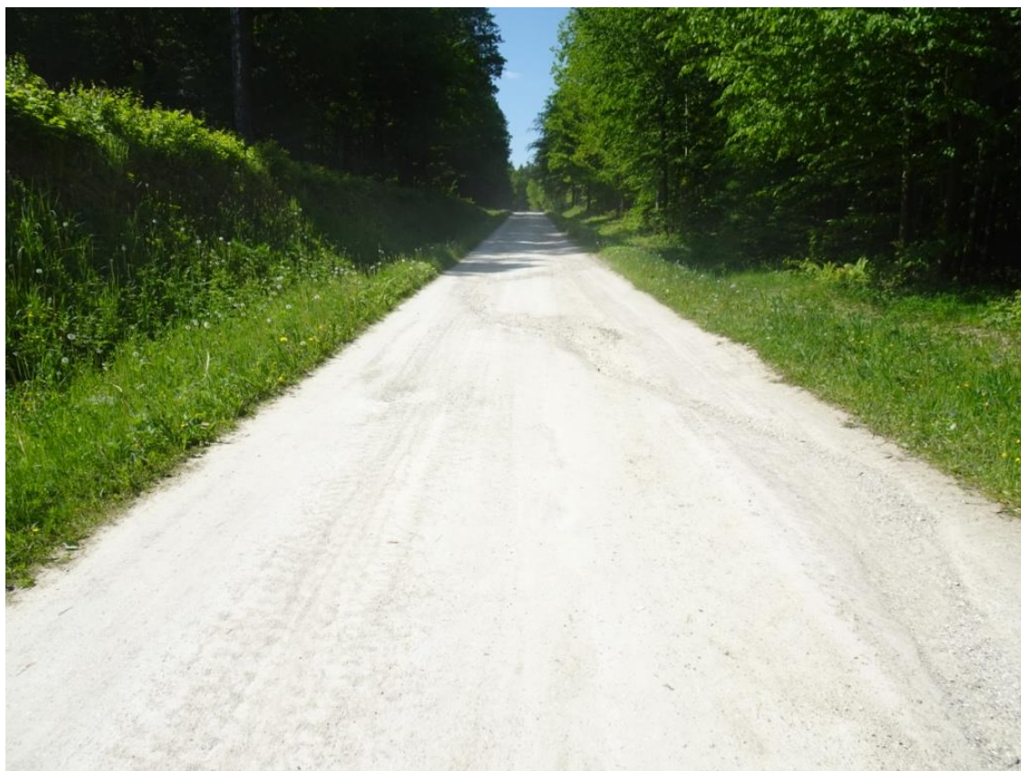
7. Szczegół wymytej nawierzchni z rozluźnionym kruszywem