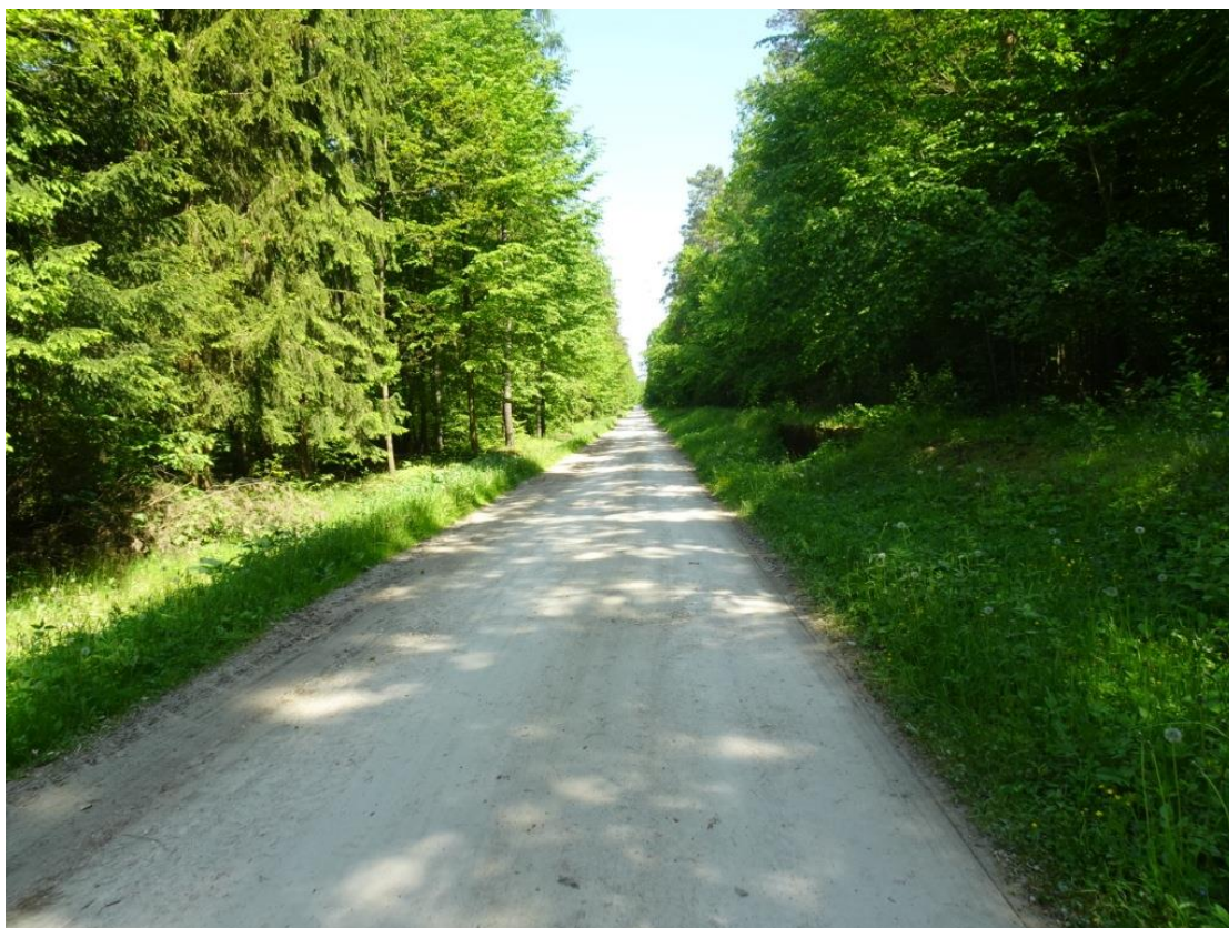
3. Widok nawierzchni z wybojami na całej szerokości jezdni i zawyżonymi poboczami