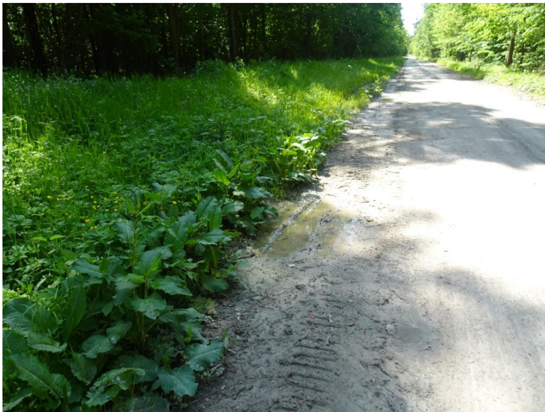
5. Widok nawierzchni z wybojami na całej szerokości jezdni i zawyżzonymi poboczami