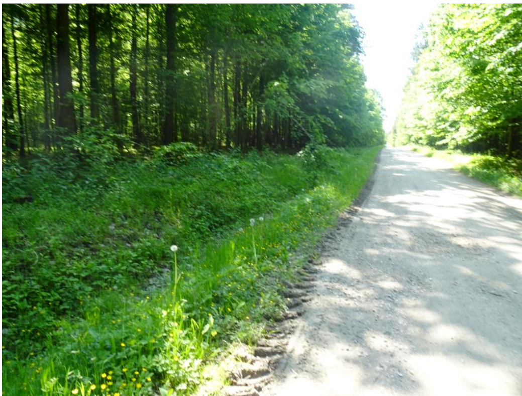
1. Widok pojedynczych wybojów

Dokumentacja fotograficzna uszkodzeń sporządzona została na podstawie zdjęć wykonanych podczas wizji w terenie.