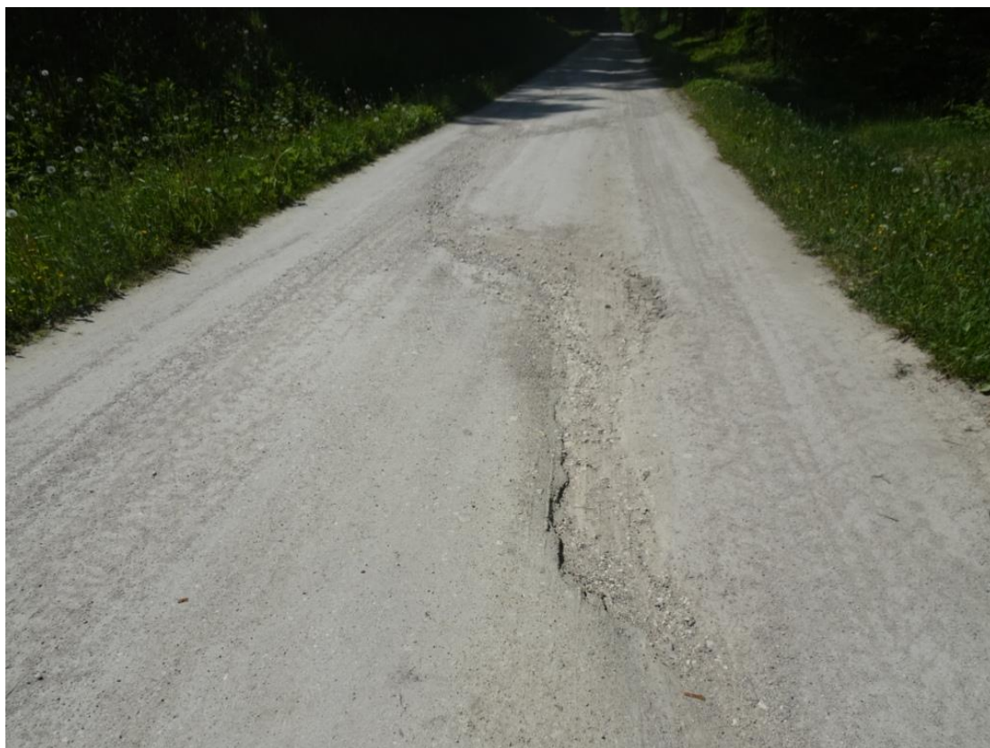
8. Szczegół wymytej nawierzchni z rozluźnionym kruszywem