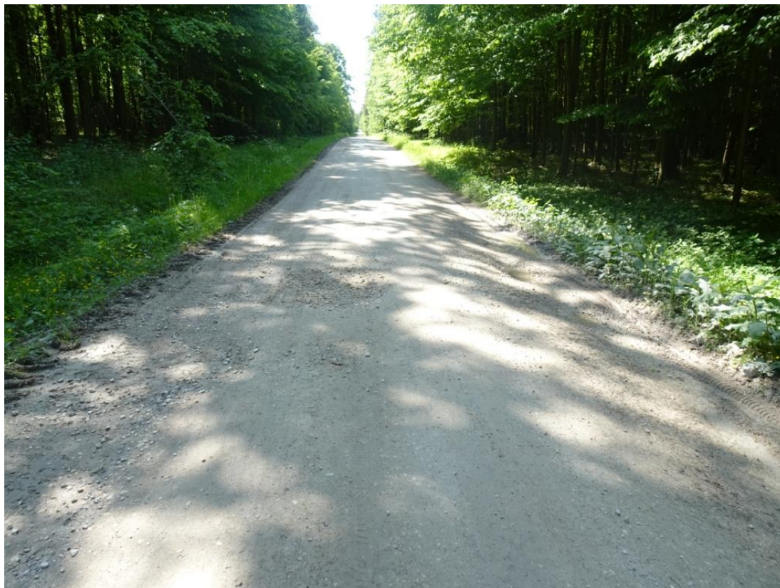
4. Widok nawierzchni z wybojami na całej szerokości jezdni i zawyżonymi poboczami