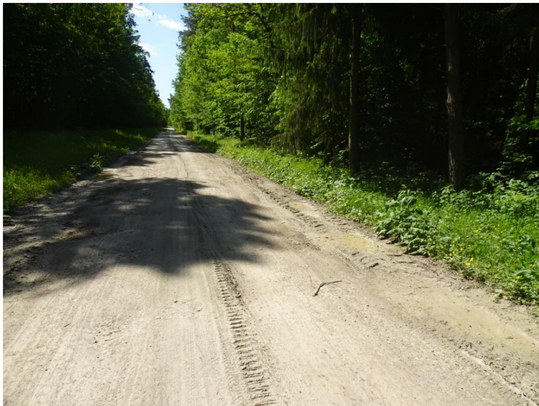
6. Widok nawierzchni z wybojami na całej szerokości jezdni i zawyżzonymi poboczami