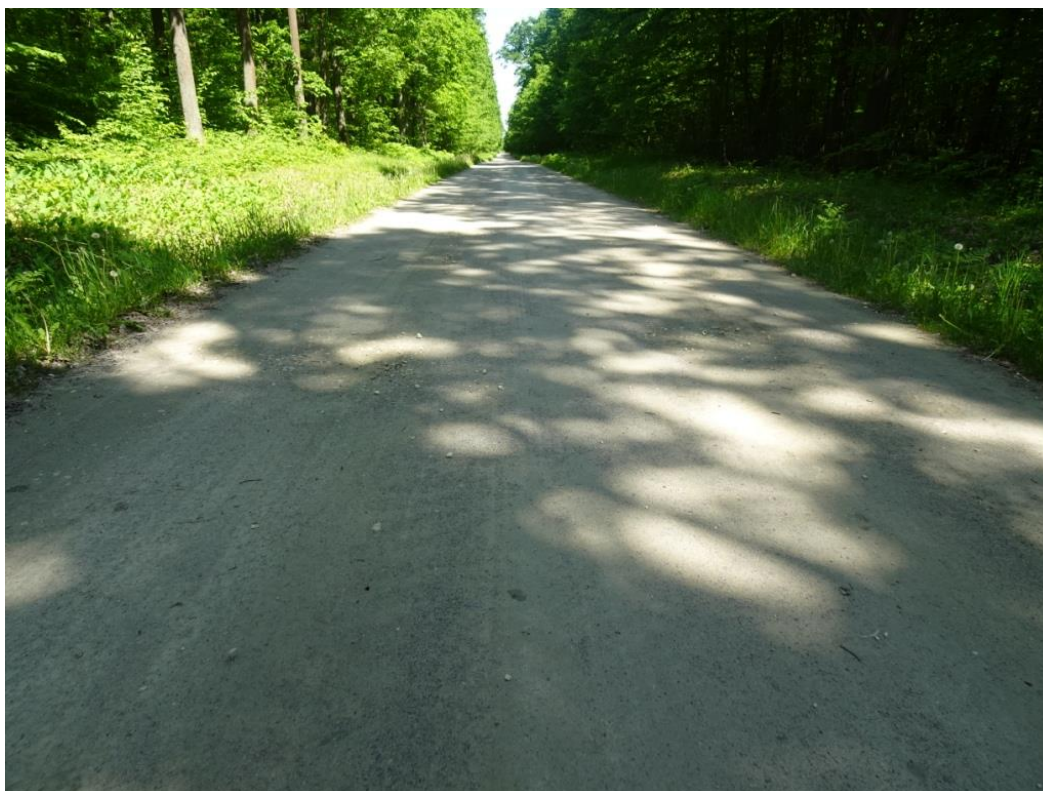
2. Widok pojedynczych wybojów