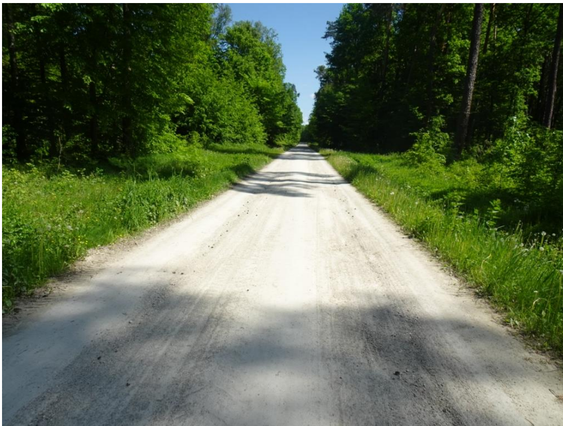
9. Szczegół koleiny z rozluźnionym kruszywem