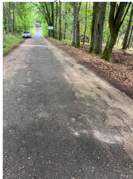
Zdjęcie nr 12