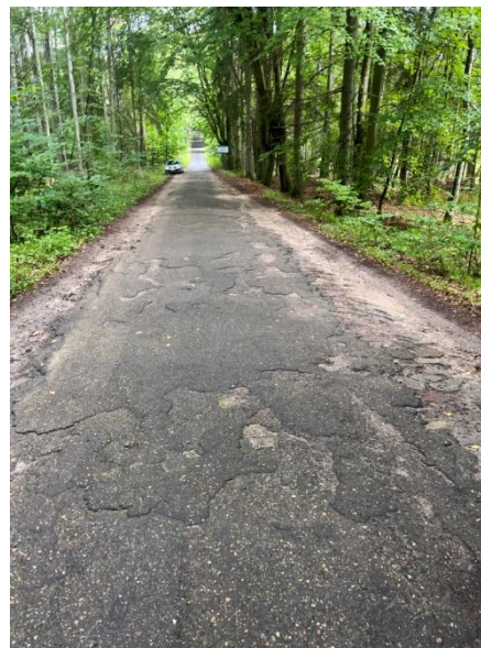
Zdjęcie nr 10