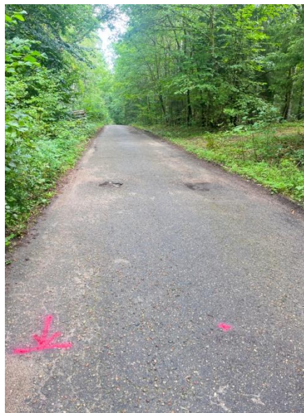
Zdjęcie nr 2-koniec odcinka