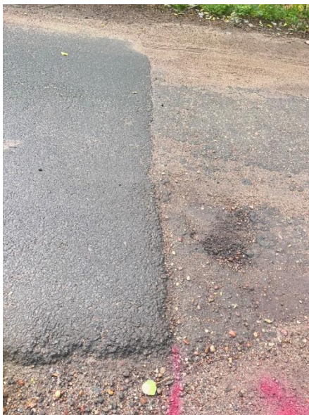
Zdjęcie nr 1 – początek odcinka

Droga gminna z ubytkami w nawierzchni. Szerokość drogi 3m. Stan drogi obrazują poniższe fotografie: