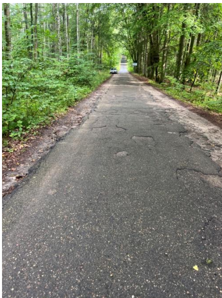
Zdjęcie nr 9