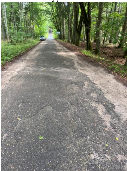
Zdjęcie nr 11