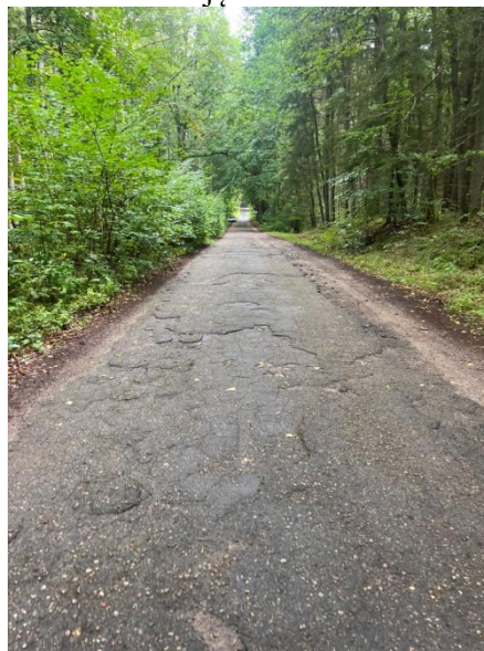
Zdjęcie nr 6