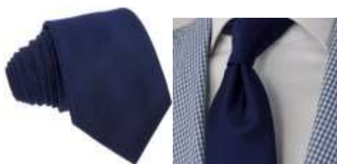
Przykładowe zdjęcie produktu

Krawat zapakowany w opakowanie jednostkowe o wymiarach 16x10cm. Opakowanie wykonane z kartonu lub podobnego materiału, w kolorze granatowym.