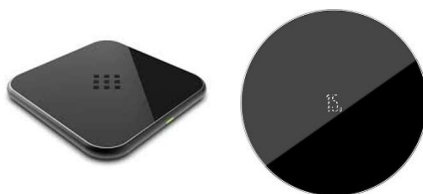
Przykładowe zdjęcie produktu

Całość zapakowana w opakowanie wykonane z tektury lub podobnego materiału.