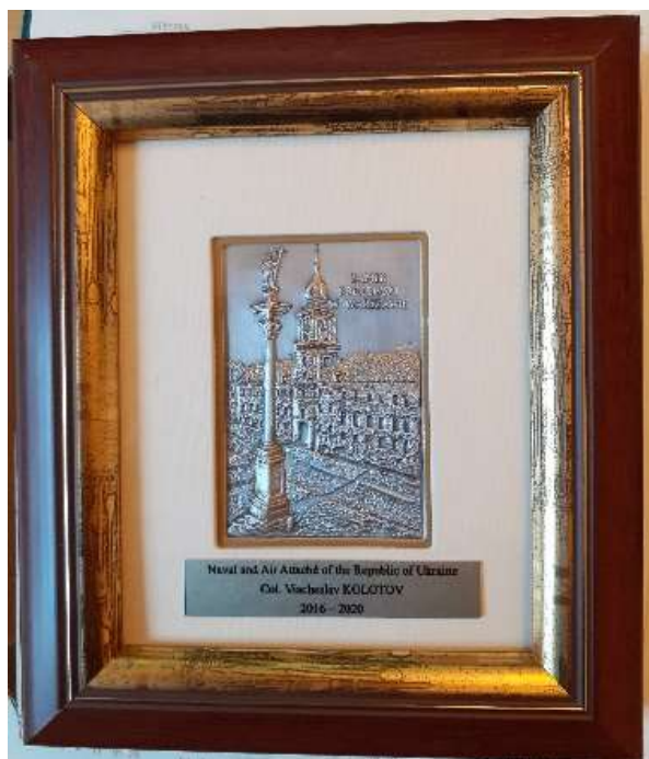
Przykładowe zdjęcie produktu

Obrazek zamontowany jest za szkłem, które chroni przed uszkodzeniem i czynnikami atmosferycznymi oraz obramowany drewnianą zdobioną ramką o wymiarach 15,5x18,5 cm (+1x1 cm). Srebrny środek zamocowany jest w passe-partout. Z tyłu znajduje się mocowanie umożliwiające powieszenie obrazka na ścianie oraz nóżka do postawienia. Całość zapakowana jest w kartonowe pudełko.