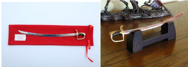
Przykładowe zdjęcie produktu

Opakowania jednostkowe zapakowane w kartonowe pudełko zabezpieczające przed zniszczeniem oraz w opakowania zbiorcze po 10 sztuk