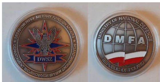
Przykładowe zdjęcie produktu

Każdy medal zapakowany w przezroczyste etui plastikowe (tzw. kapsel) z krawędziami gładko zeszlifowanymi, pozbawionymi tzw. zadziarów. Etui otwierane, umożliwiające wyjęcie z niego medalu. Medale pakowane w pudełka zbiorcze po 10 sztuk, zabezpieczające etui przed uszkodzeniem i porysowaniem. W kartonie zbiorczym 50 sztuk.