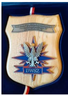
Przykładowe zdjęcie produktu

Wszystkie plakietki opakowane jednostkowo w etui z tektury introligatorskiej, pokryte materiałem introligatorskim o fakturze przypominającej skórę, w kolorze granatowym, o wymiarach odpowiednich do umieszczenia plakietki (nie większych i nie mniejszych). Rogi wieczka i spodu okute metalem, wieczko uchylne, wewnątrz wklejone pudełko oklejone tym samym materiałem wyściełane aksamitem w kolorze granatowym, wewnątrz — centralnie umieszczone zagłębienie odpowiadające wielkością rozmiarowi i kształtowi plakietki, głębokość 15 mm. W środku wgłębienia zamocowana wstążka atlasowa w kolorze białoczerwonym, umożliwiająca wyjęcie plakietki z zagłębienia. Etui do zaakceptowania przez Zamawiającego w terminie do 14 dni od daty zawarcia umowy. Plakietki opakowane w opakowania zbiorcze (karton) po 25 sztuk.