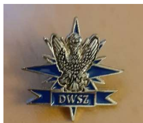
Przykładowe zdjęcie produktu.

Znaczek metalowy emaliowany (ang. pin) w kształcie logo DWSZ. Znaczek o wymiarach 2x2cm. Umieszczony w estetycznym etui/opakowaniu jednostkowym koloru ciemnogrnatowego wykonanym z plastiku, z przezroczystym przykryciem z folii utwardzanej. O wymiarach 4x4cm