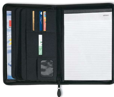
Przykładowe zdjęcie produktu

Wymiary produktu: 36 x 25 x 2,2 cm (+/- 1 cm).