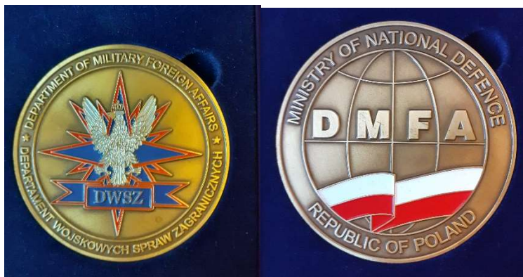
Przykładowe zdjęcie produktu.

Każdy medal zapakowany oddzielnie we flokowane, otwierane etui w kolorze granatowym o wymiarach odpowiednich do umieszczenia medalu. Etui z wewnętrznym gniazdem o wielkości medalu z wyłobieniem umożliwiającym wyjęcie przedmiotu. Medale pakowane w pudełka zbiorcze po 10 sztuk, zabezpieczające etui przed uszkodzeniem i porysowaniem. W kartonie zbiorczym 50 pudełek.