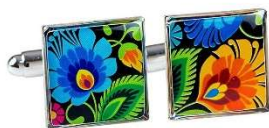
Przykładowe zdjęcie produktu

Wykonawca przedstawi Zamawiającemu prototyp spinek do wglądu przed wykonaniem całości zamówienia.