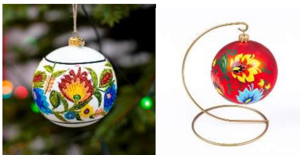
Przykładowe zdjęcie produktu

Opakowanie (do bombek w kolorze białym) – pudełko kartonowe, laminowane po całości folią błyszczącą, o wymiarach 12,5 cm x 12,5cm x 20,5 cm (+/-1 cm), w kolorze białym (odcień do uzgodnienia z Zamawiającym) bez nadruku. Pudełko umożliwiające schowanie bombki wraz ze stojakiem i unieruchomienie jej. W pudełku w czterech bocznych ścianach wycięcia o wymiarach: 8,7 cm x 11 cm, pozwalające na zobaczenie bombki. Pakowane zbiorczo po 25 sztuk i okręcone folią paletową.