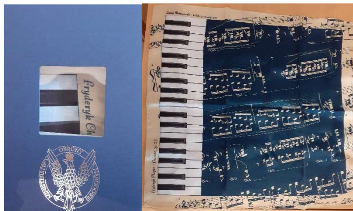
Przykładowe zdjęcie produktu