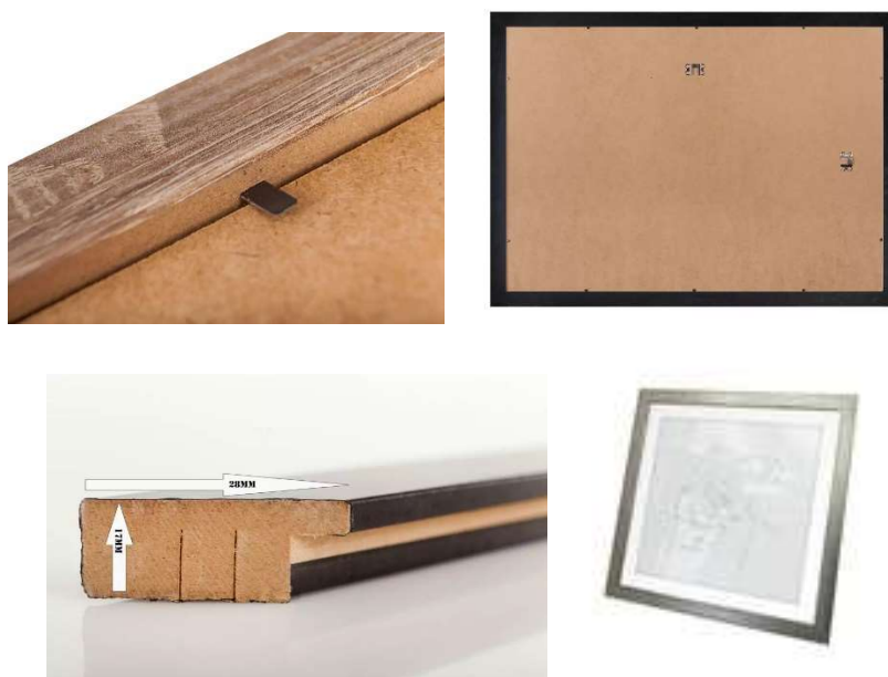
Przykładowe zdjęcie produktu

Wymiary zewnętrzne ramki 32,8 x 25,8. Wymiary wewnętrzne ramki 30 x 23cm