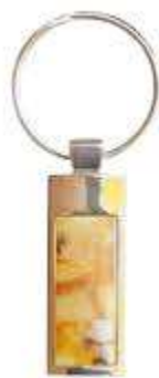
Przykładowe zdjęcie produktu