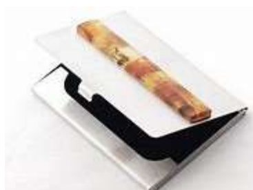
Przykładowe zdjęcia produkt