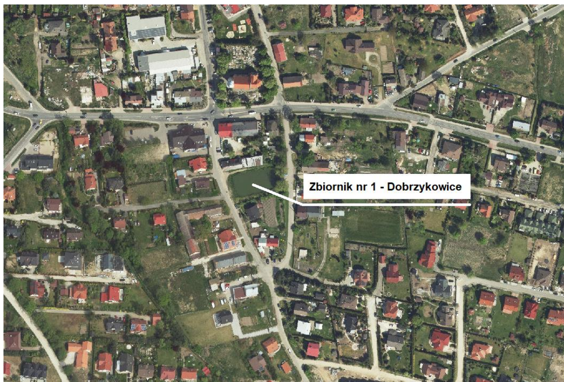
Zbiornik nr 1 - Dobrzykowice