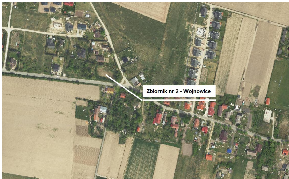
Zbiornik nr 2 - Wojnowice