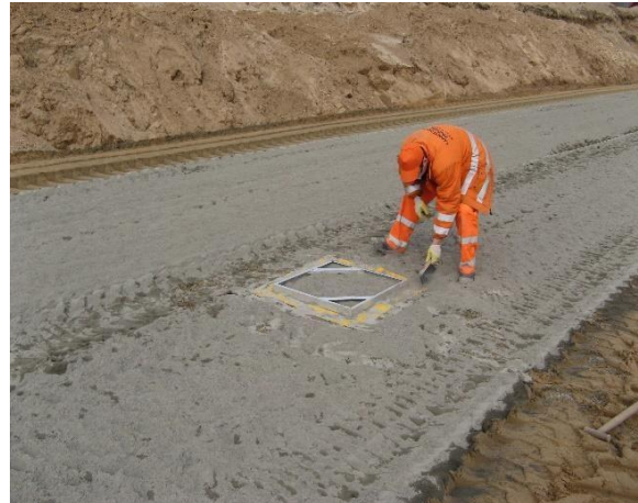
Wymiatanie z tacki pomiarowej spoiwa znajdującego się poza szablonem