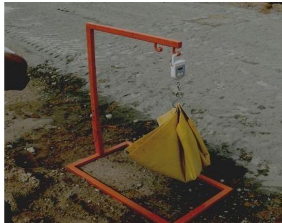
Ważenie tacki pomiarowej ze spoiwem

Uwaga – przy wykonywaniu pomiaru ilości dozowanego spoiwa bezwzględnie należy stosować środki ochrony osobistej wymienione w karcie charakterystyki substancji chemicznej dotyczącej stosowanego spoiwa.