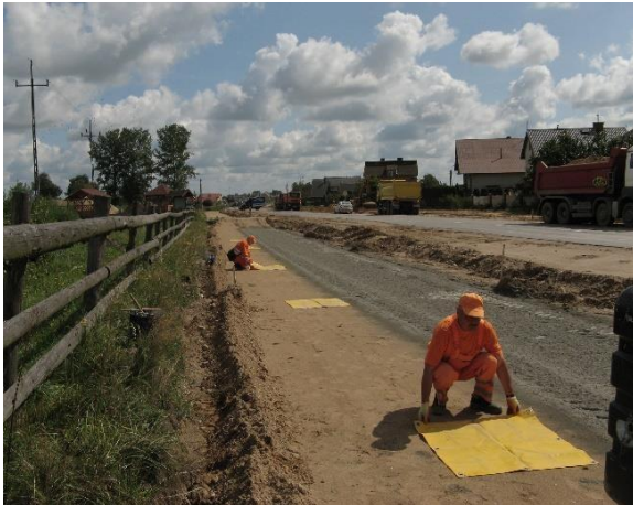
Rozmieszczenie tacek pomiarowych

Zasada pomiaru – Próbkę spoiwa pobiera się podczas jednego przejścia rozsypywarki. Do pomiaru należy użyć co najmniej siedem kwadratowych tacek pomiarowych. Tacki pomiarowe należy równomiernie rozmieścić na odcinku roboczym, którego szerokość odpowiada szerokości rozsypywarki. Na zdjęciach poniżej pokazano poszczególne czynności związane z wykonaniem pomiaru ilości dozowanego spoiwa, w którym wykorzystywane są kwadratowe tacki pomiarowe z brezentu o wymiarach 1 m x 1 m i kwadratowy szablon - ramka z lekkiego metalu o wymiarach: 0,71 m x 0,71 m x 0,10 m.