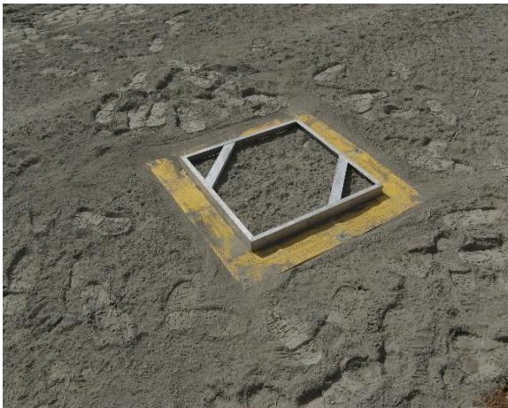
Tacka pomiarowa ze spoiwem rozłożonym na powierzchni 0,5 m 2