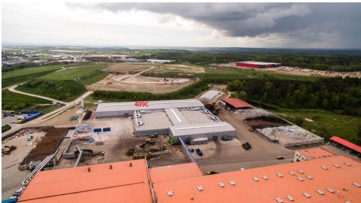
Zdj.3 Widok obiektu od strony północnej