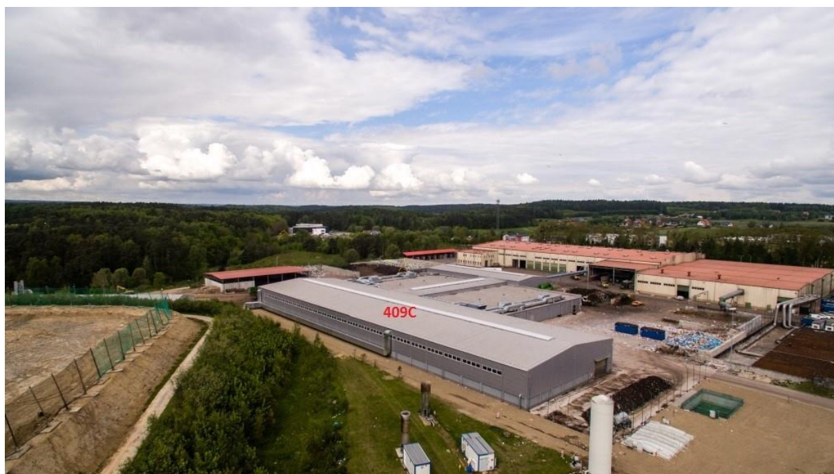
Zdj.1 Widok obiektu od strony południowo-wschodniej