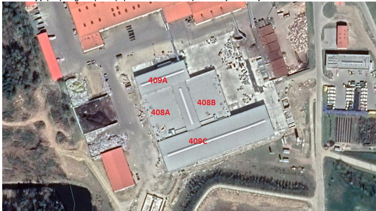
Rys. 1 Lokalizacja przedmiotu zamówienia.

Ze względu na liczną obecność ptaków i możliwość zanieczyszczenia paneli fotowoltaicznych Zamawiający wymaga użycia optymalizatorów mocy dla całej instalacji.