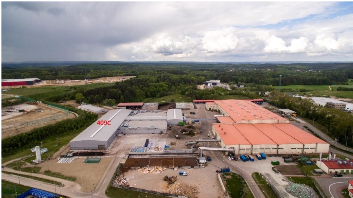
Zdj.2 Widok obiektu od strony wschodniej