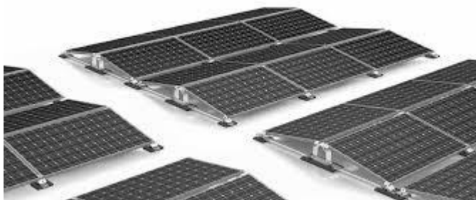
Rys.4 Przykład konstrukcji w orientacji zachód-wschód

Konstrukcja (zestawy montażowe) powinna być wykonana zgodnie z projektem, z materiałów niekorodujących np. aluminium czy stal nierdzewna.