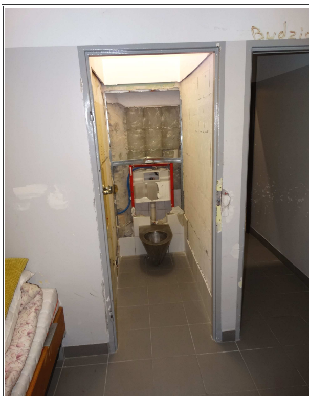
fotografia nr 7

Izba chorych na parterze (pom. nr 1.35) z WC (pom. nr 1.36)