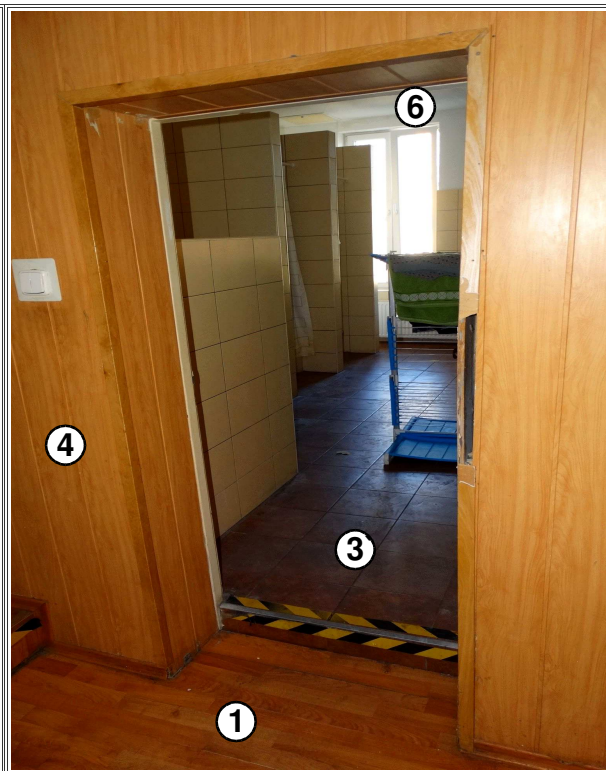
fotografia nr 5

Korytarz skrzydła zachodniego 1 piętra budynku głównego ZP (pom. nr 2.21 i 2.24) – widok od strony świetlicy