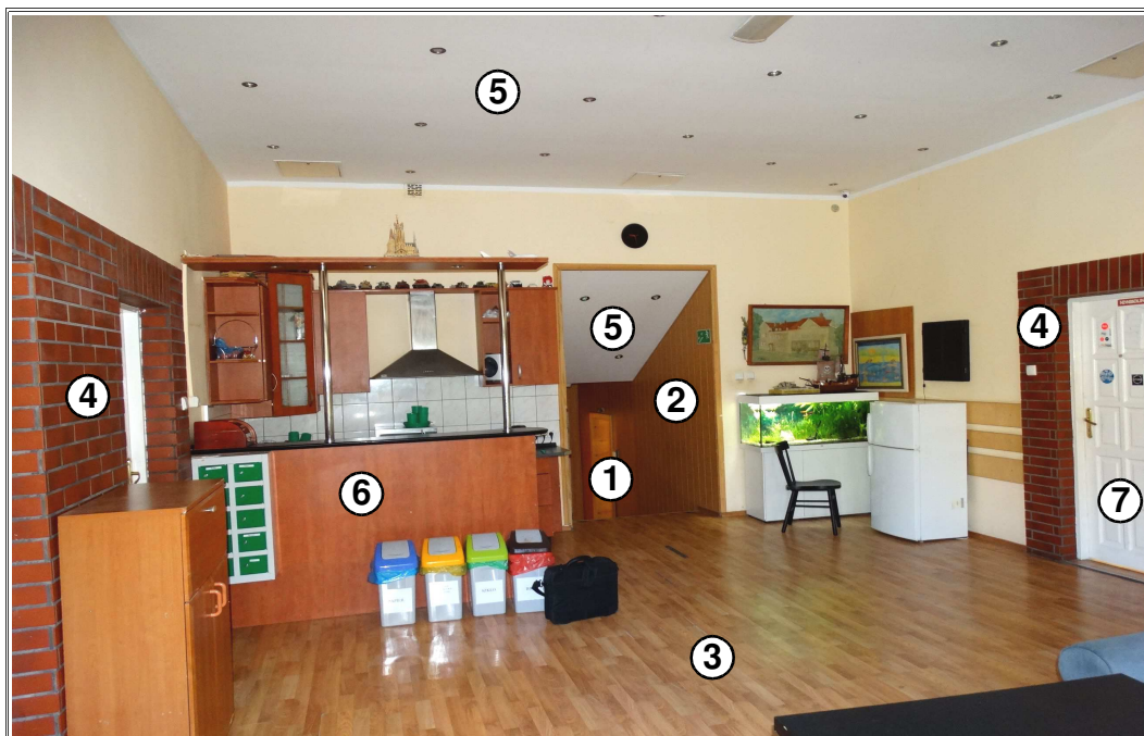
fotografia nr 3

Pomieszczenie świetlicy (pom. nr 2.28 ) na 1 piętrze budynku głównego ZP