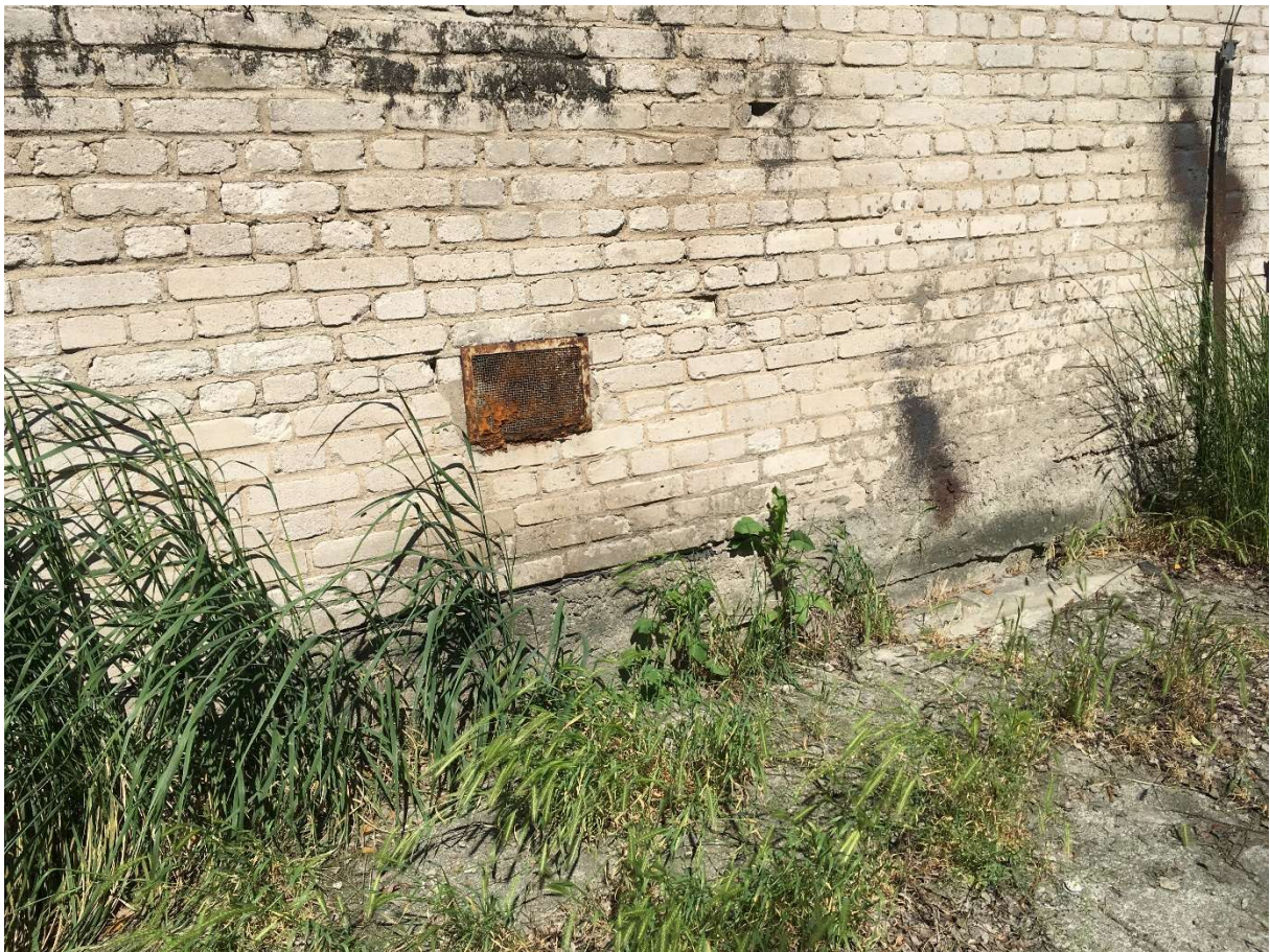
Zdjęcie nr 14 – kratka wentylacyjna na elewacji magazynu nr IV