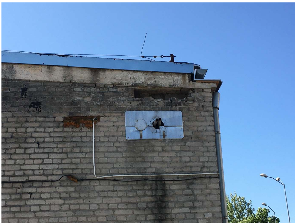
Zdjęcie nr 8 – fragment elewacji północnej magazynu nr IV