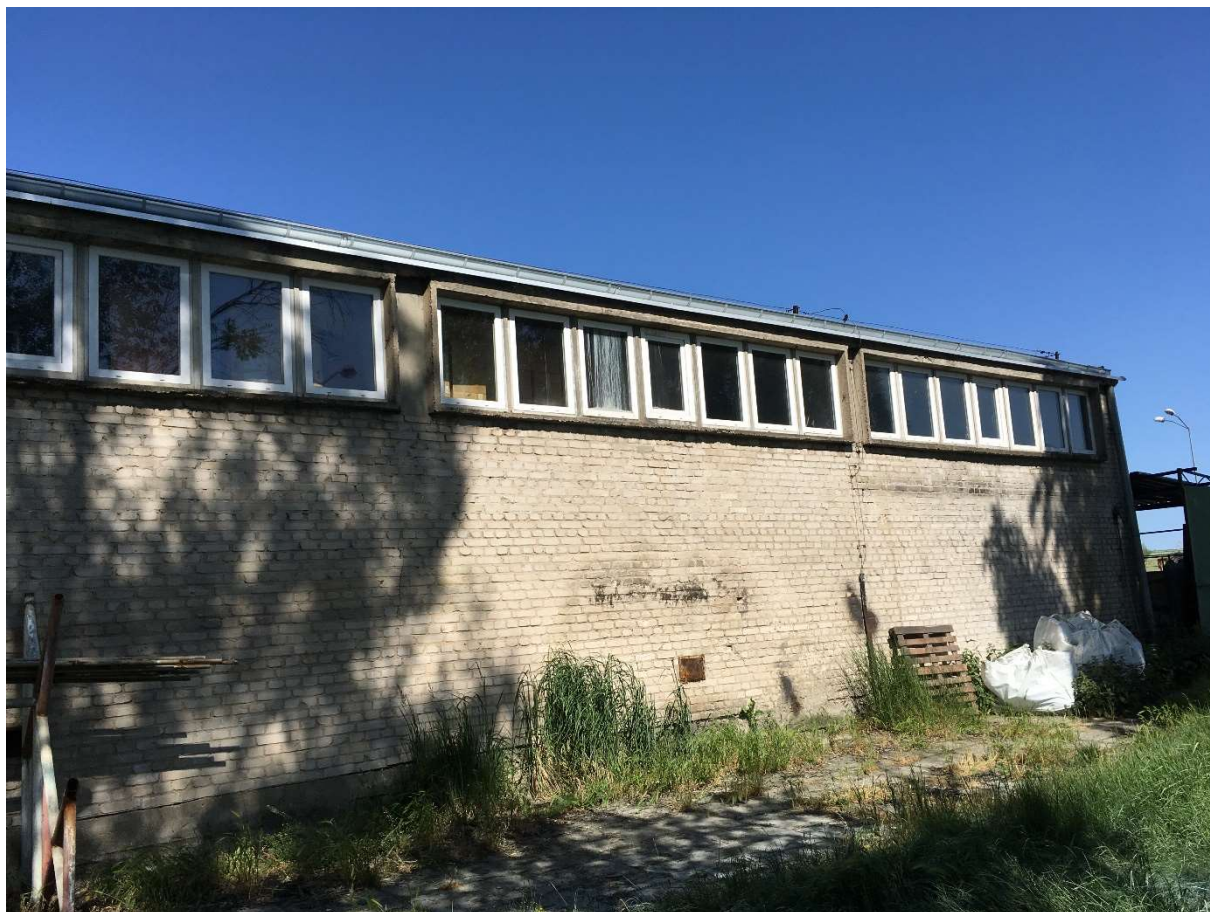
Zdjęcie nr 3 – część elewacji wschodniej magazynu nr IV