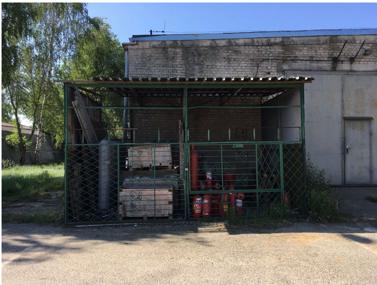
Zdjęcie nr 10 – wiata z blachy stalowej stojącej przy magazynie nr IV (elewacja północna)