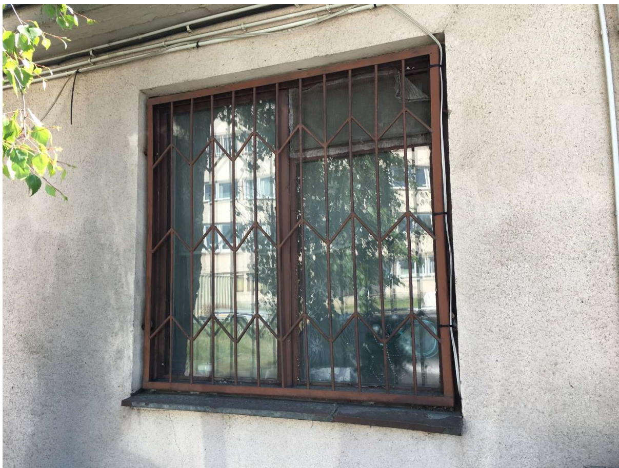
Zdjęcie nr 7 – okno przybudówki