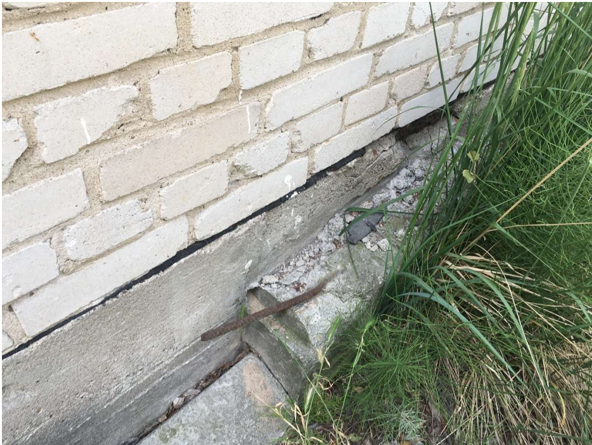
Zdjęcie nr 13 – cokół magazynu nr IV