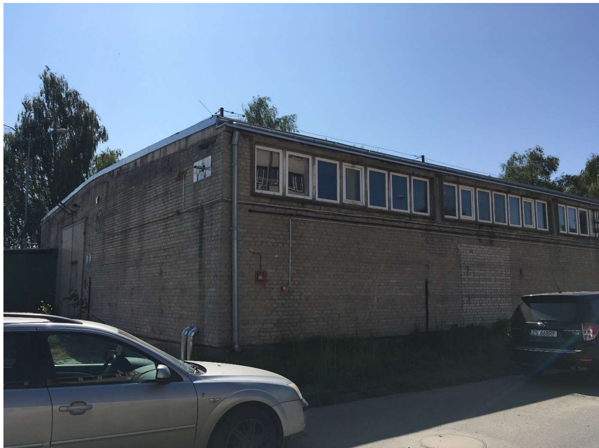
Zdjęcie nr 2 – elewacja północna i fragment zachodniej magazynu nr IV