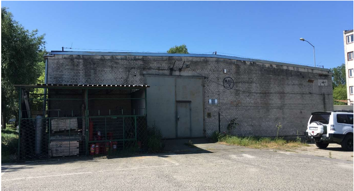
Zdjęcie nr 1 – elewacja północna magazynu nr IV