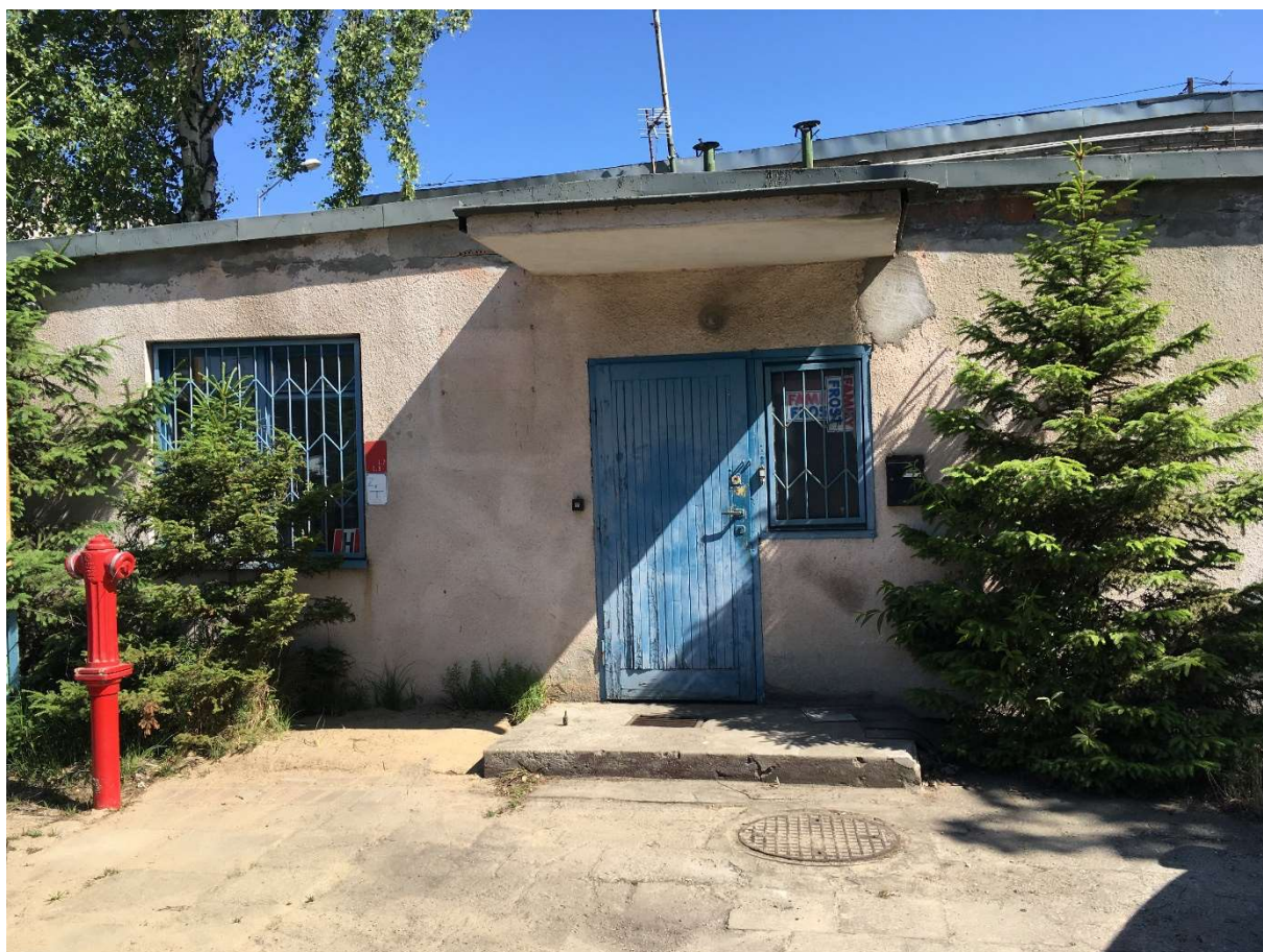
Zdjęcie nr 6 – przybudówka – strefa wejściowa