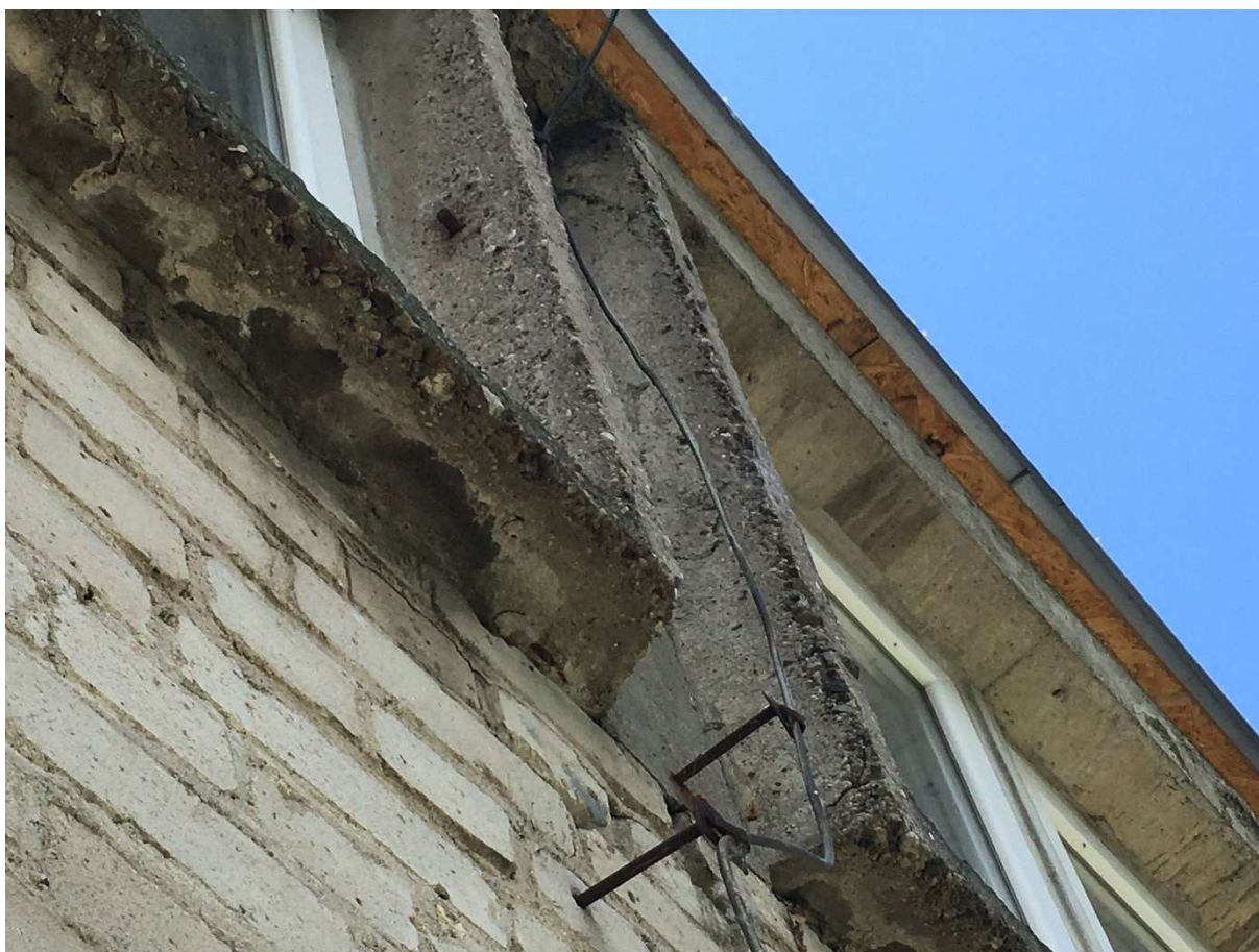
Zdjęcie nr 12 – żelbetowa rama okien magazynu nr IV