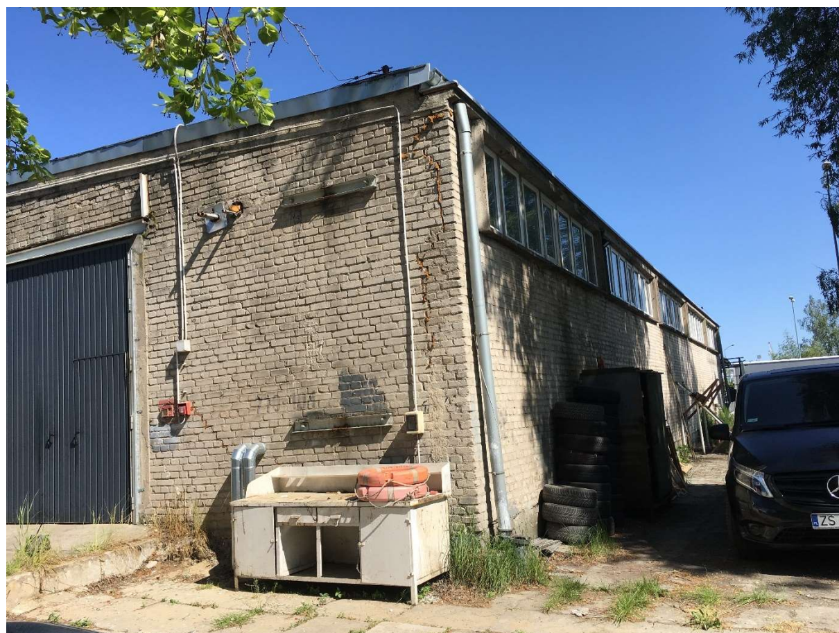
Zdjęcie nr 4 – fragment elewacji południowej i wschodniej magazynu nr IV