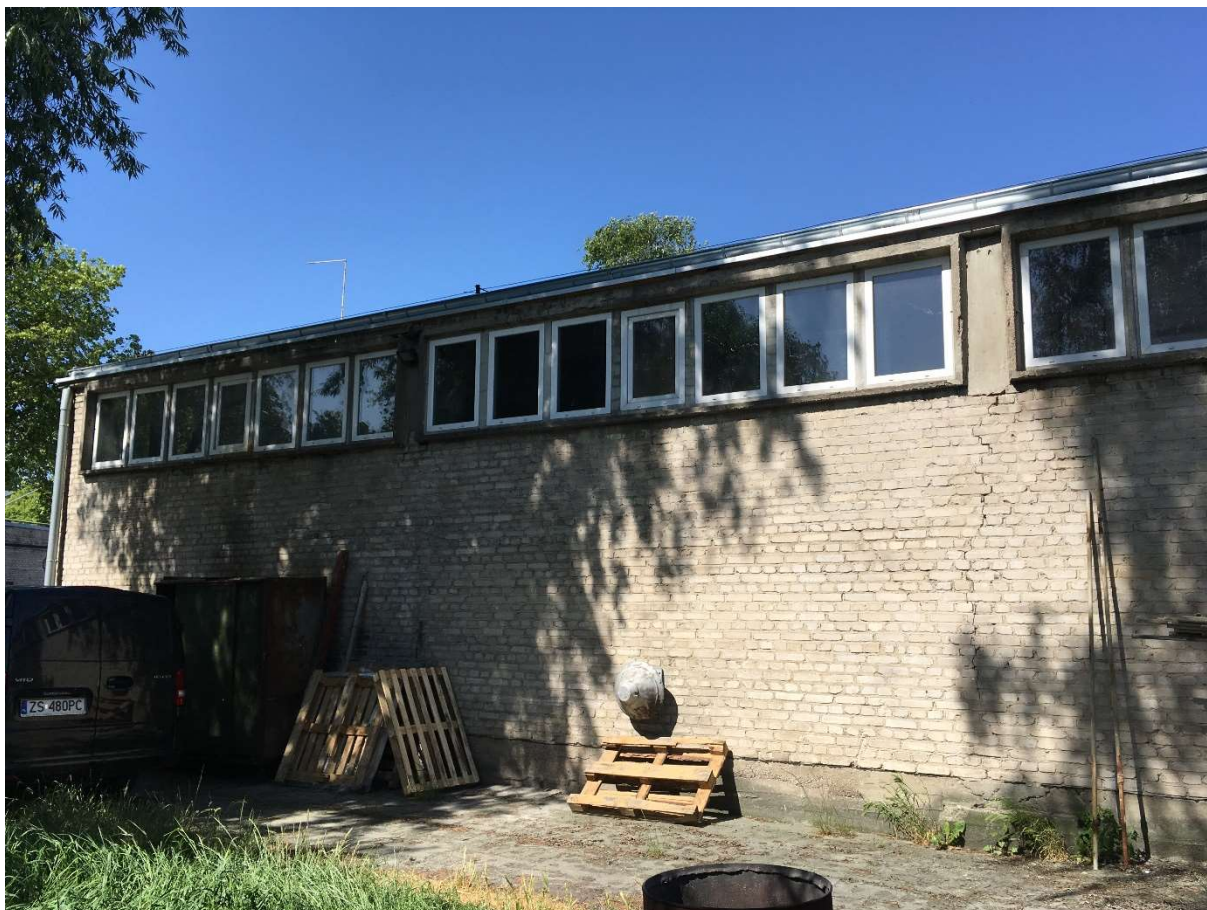
Zdjęcie nr 11 – fragment elewacji wschodniej magazynu nr IV