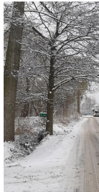
Topola obwód pnia 298 cm, Olsza szara obwód pnia 151

Pozostała wycinka drzew obejmuje krzaki o małych średnicach.