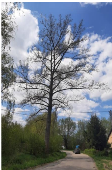
Topola włoska obwód pnia 350 cm

Zamawiają poniżej przedstawia zestawienie większych 8 drzew przewidzianych do wycięcia.