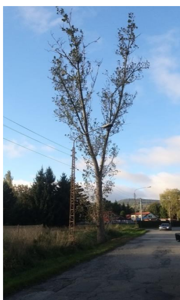
Topola włoska obwód pnia 168 cm