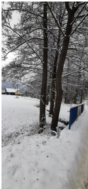
Olsza szara obwód pnia 152 cm