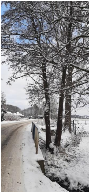
Olsza szara obwody pni: 148cm 146 cm