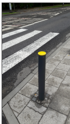
Słupek wygradzający na przejściach dla pieszych oraz na peronie autobusowym