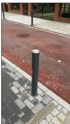
Słupek wygradzający po za przejściami dla pieszych