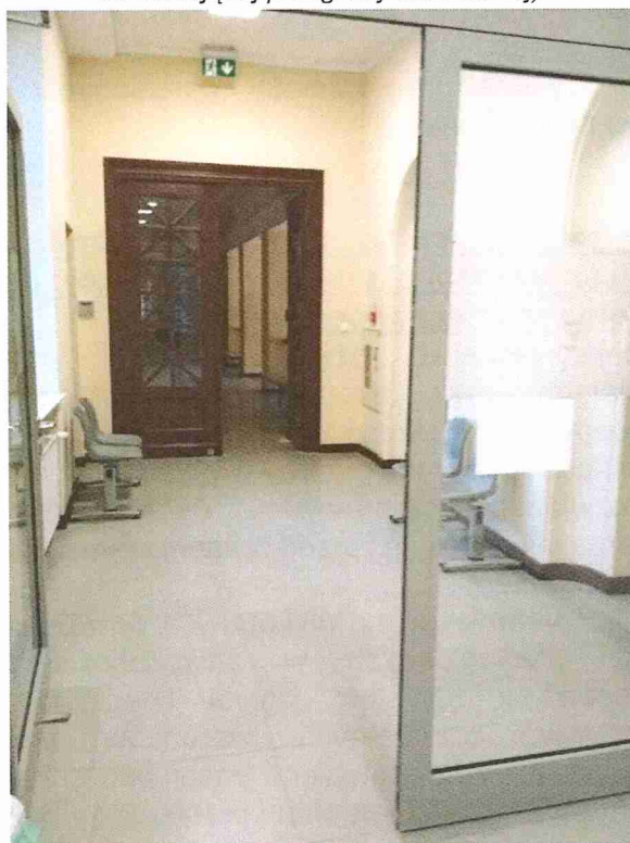
Podział stref jak w budynku Collegium Heliodori Święcicki (przegroda ppoż. zamontowana niezależnie od istniejącej przegrody drewnianej)