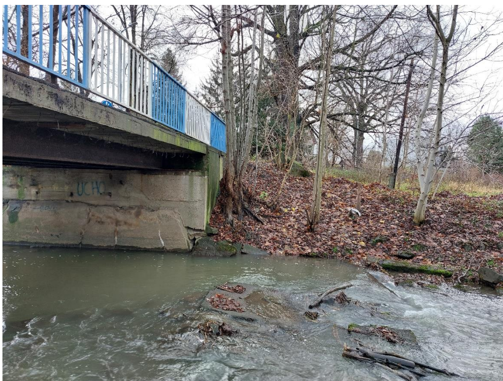
Fot. 4 Wegetacja roślin / drzew w pobliżu skrzydeł mostu. Uszkodzone murki oporowe dochodzące do obiektu. Ubytki betonu przyczółka.