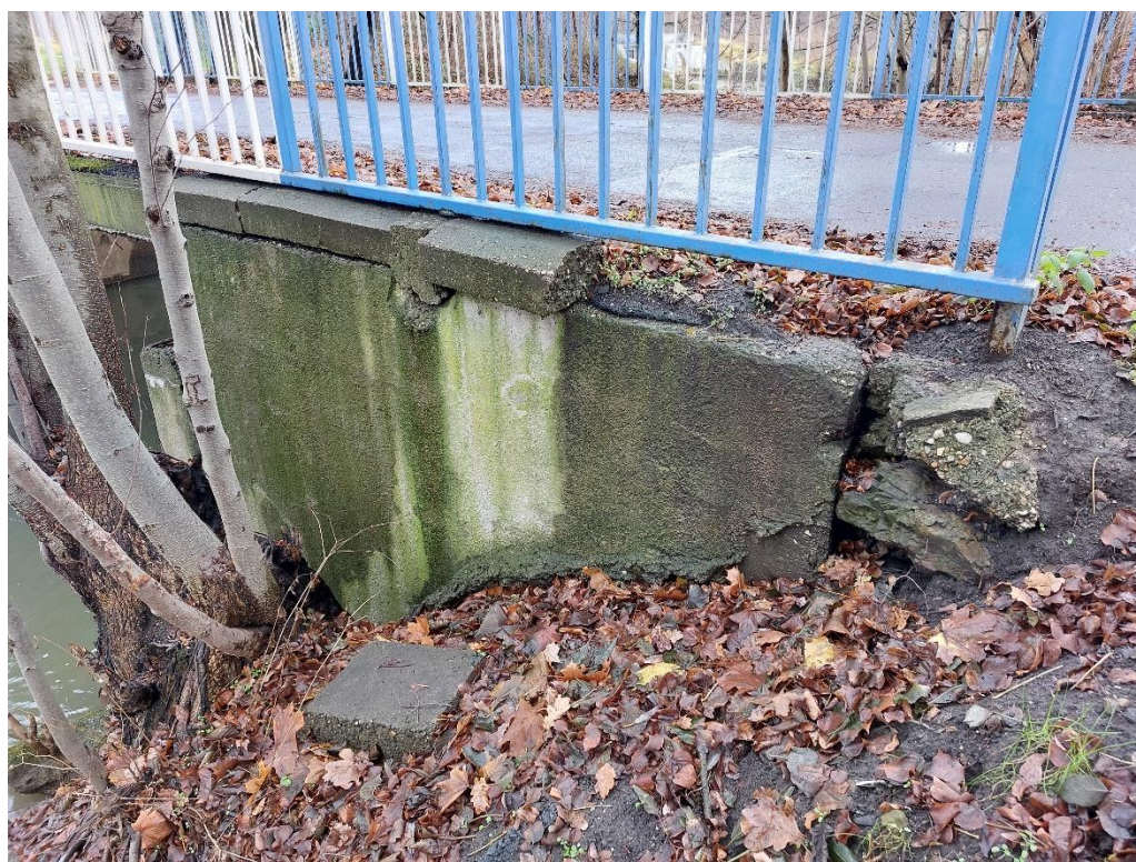
Fot. 6 Uszkodzenia i ubytki gzymsów.