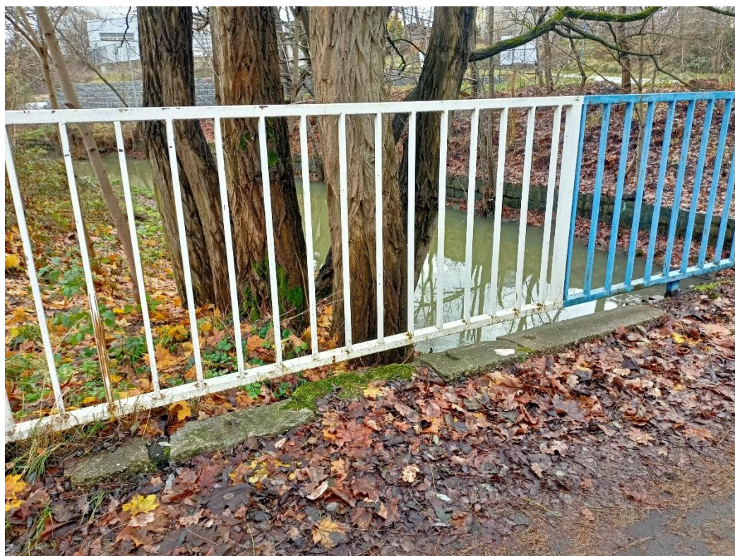
Fot. 8 Wykwity korozyjne na balustradach.