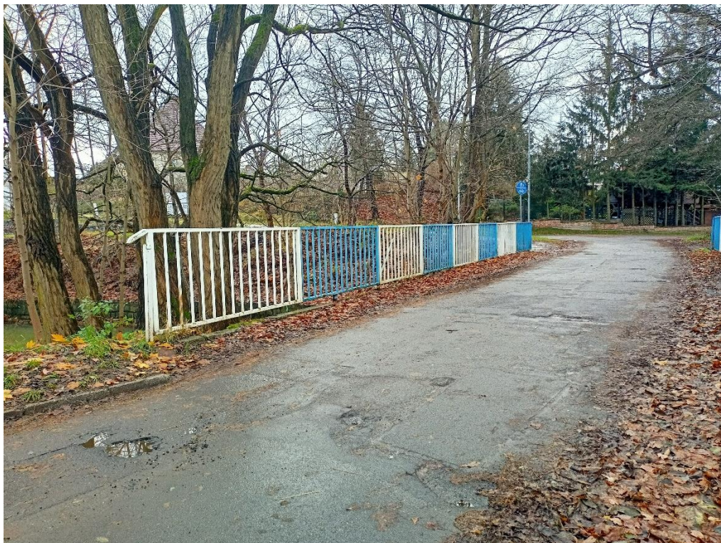
Fot. 7. Uszkodzenia i ubytki nawierzchni. Brak ciągłości krawężników. Brak chodników. Zanieczyszczenia obiektu.