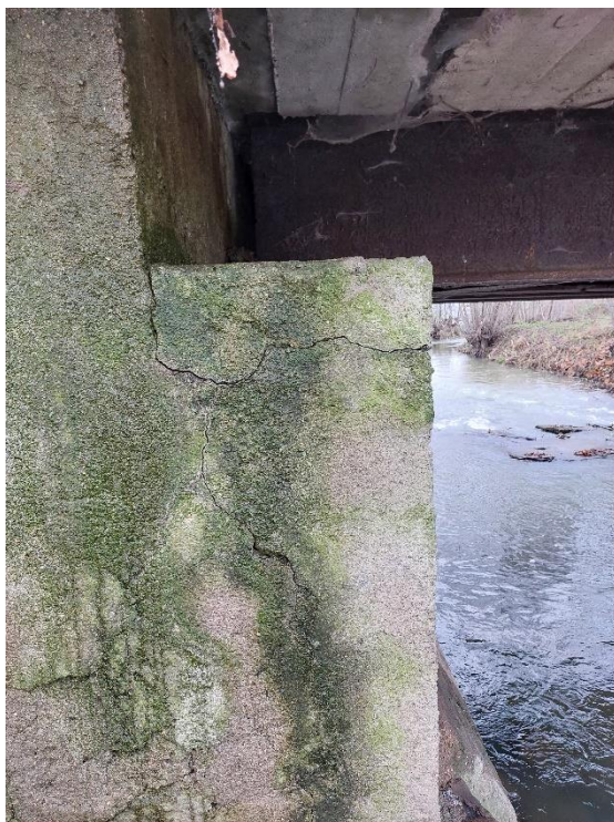
Fot. 5. Zawilgocenia, spękania i zarysowania ławy podłożyskowej.