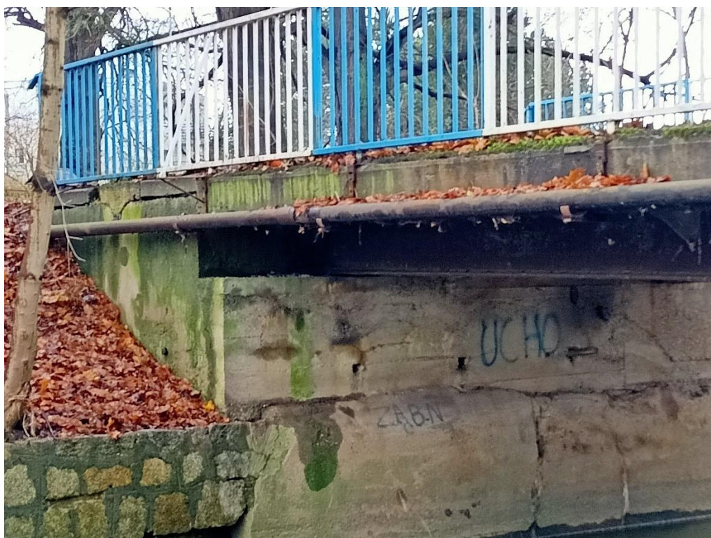
Fot. 3 Zarysowania, pęknięcia, przecieki, zanieczyszczenia, erozja i wykwyty na przyczółkach.