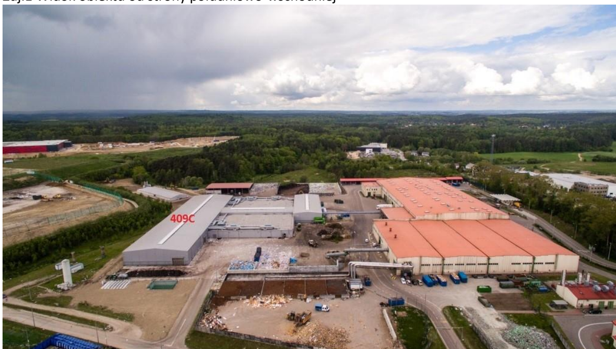
Zdj.2 Widok obiektu od strony wschodniej