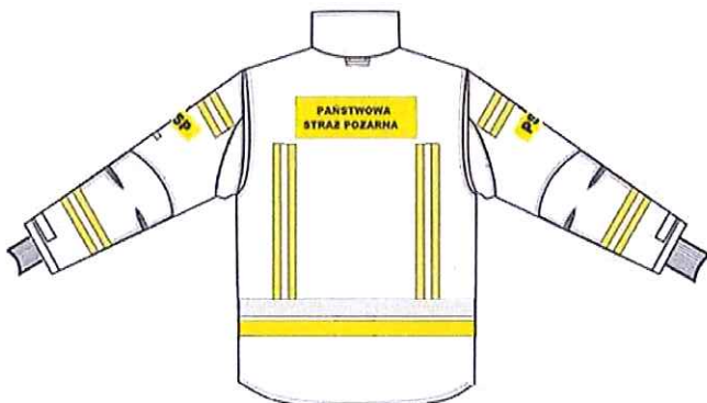
Przykładowy widok kurtki