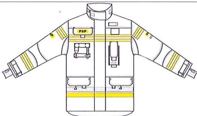
Przykładowy widok kurtki