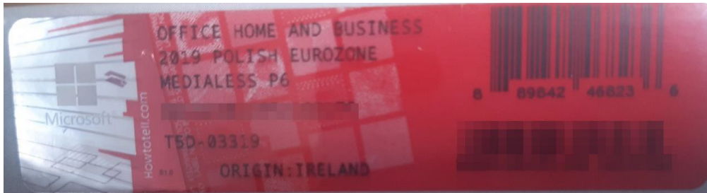
Rys. 2 przykładowy kod zabezpieczony przez producenta systemu Microsoft Windows Office Home&Business z wymazanym, znajdującym się w prawym dolnym rogu numerem seryjnym produktu. Kod licencyjny znajduje się w środku szczególnie zapakowanego i zafoliowanego pudełka (Rys. 3)