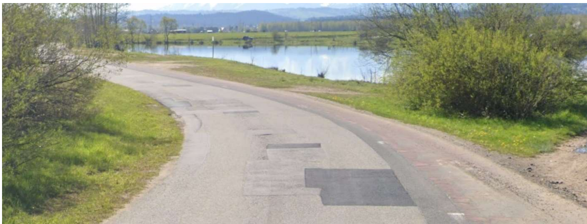
Konieczna do remontu nawierzchnia drogi i ścieżki rowerowej