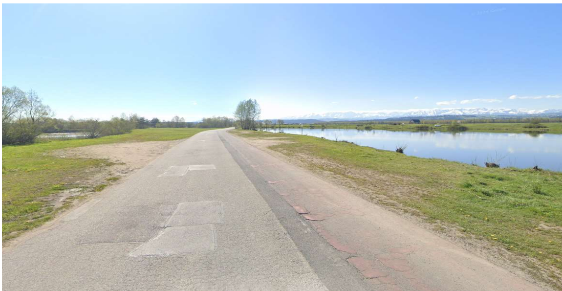
Konieczna do remontu nawierzchnia drogi i ścieżki rowerowej