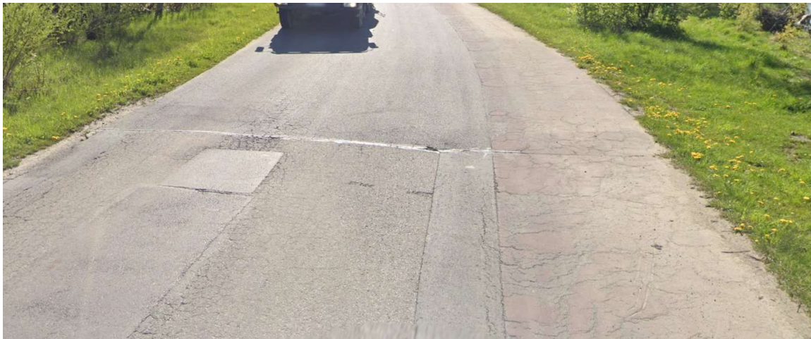
Konieczna do remontu nawierzchnia drogi i ścieżki rowerowej