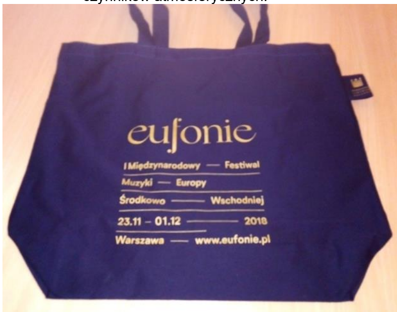
Prawdopodobny wzór znakowania (inny format torby)