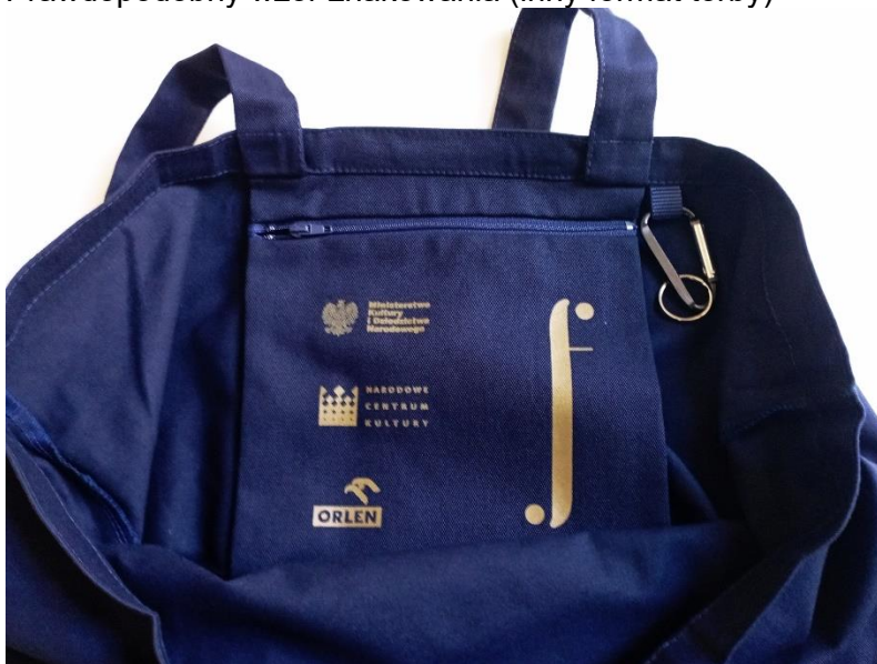
Prawdopodobny wzór oznakowania kieszeni (inny format torby)