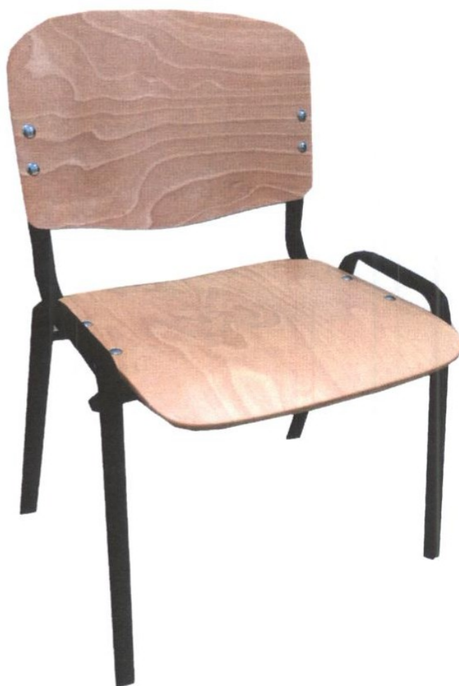
Zdjęcie poglądowe nr 1

Wzór krzesła biurowego na metalowej podstawie - twardego przedstawia zdjęcie poglądowe nr 1.