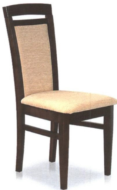
Zdjęcie poglądowe nr 4

Miejsca dostaw krzesel biurowych drewnianych - wyściełanych: