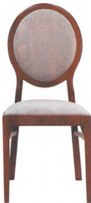
Zdjęcie poglądowe nr 8

Miejsce dostawy krzesel gabinetowych drewnianych: