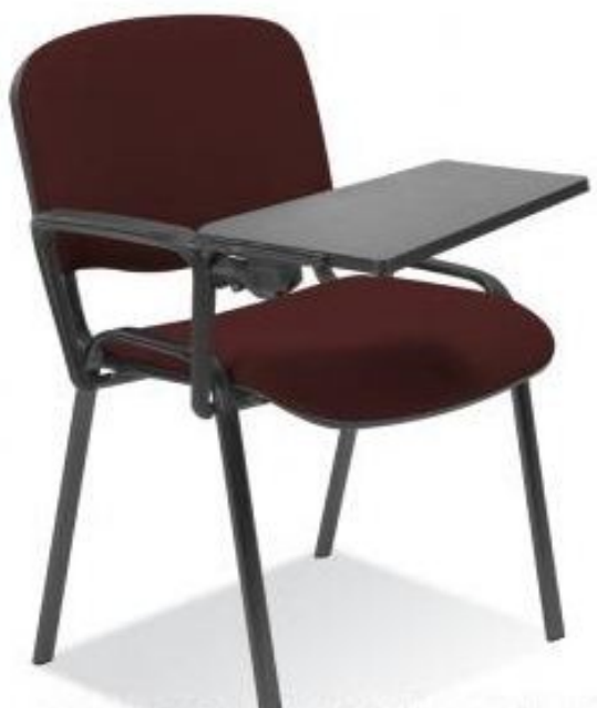
Zdjęcie poglądowe nr 3

Miejsca dostaw krzeseł biurowych na metalowej podstawie z pulpitem – wyściełanych