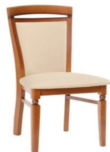
Zdjęcie poglądowe nr 7