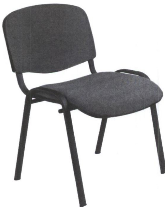
Zdjęcie poglądowe nr 2

Miejsca dostaw krzeseł biurowych na metalowej podstawie - wyściełanych: