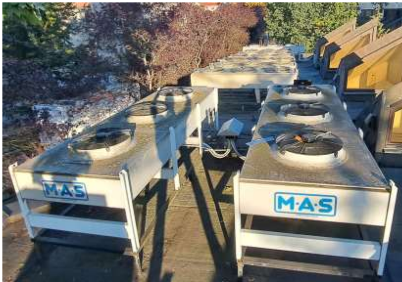
Rysunek 2 Skraplacze Thermokey M.A.S.

PN 14/08/2024 – rozbudowa systemu chłodzenia