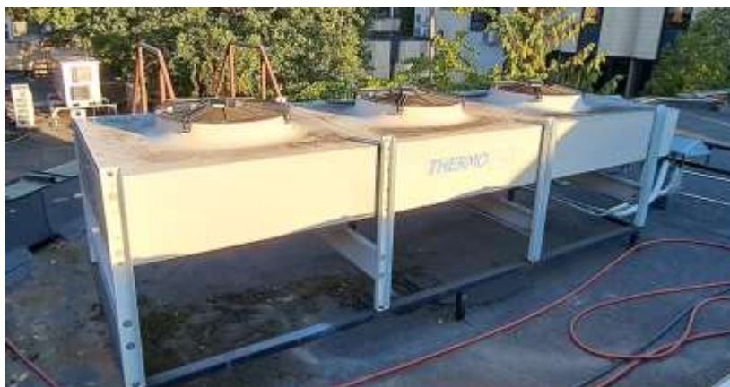
Rysunek 3 Skraplacz Thermokey M.A.S.