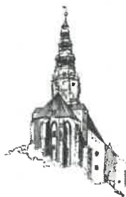
Kościół pw. Św. Stanisława i Św. Wacława Katedra Diecezji Świdnickiej

Zgodnie z art. 436 pkt 1) ustawy Pzp Zamawiający nie ma obowiązku podania konkretnej daty planowanego zakończenia robót budowlanych jeżeli jest to uzasadnione obiektywną przyczyną. Inwestycja pn. „Budowa z przebudową ul. Inżynierskiej w Świdnicy” jest przewidziana do dofinansowania w latach 2023-2024 z Rządowego Funduszu Rozwoju Dróg. Zgodnie ze złożonym wnioskiem termin finansowego zakończenia realizacji mija wraz z dokonaniem przez Zamawiającego wszystkich płatności z tytułu umów zawartych z wykonawcami zadania, nie później jednak niż w terminie 30 dni od dnia rzeczowego zakończenia zadania. W tej sytuacji dzień 30 listopada 2024 r. jest ostatecznym terminem rzeczowego zakończenia zadania, a podanie daty planowanego zakończenia robót budowlanych za pomocą konkretnej daty jest obiektywnie uzasadnione.