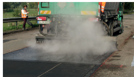
Skropić emulsją bitumiczną