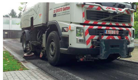
Oczyszczyć i wysuszyć podłoże