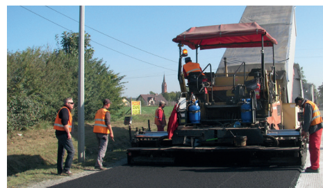
Ułożyć warstwę z mma