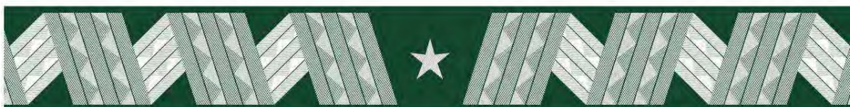
nadinspektor – otok czapki wyjściowej