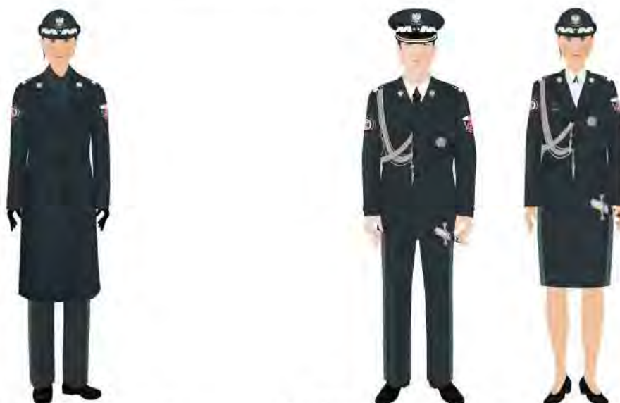
Funkcjonariusz w stopniu generała ubrany w płaszcz.