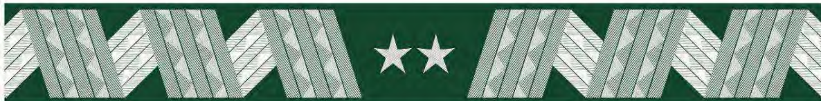
generał – otok czapki wyjściowej