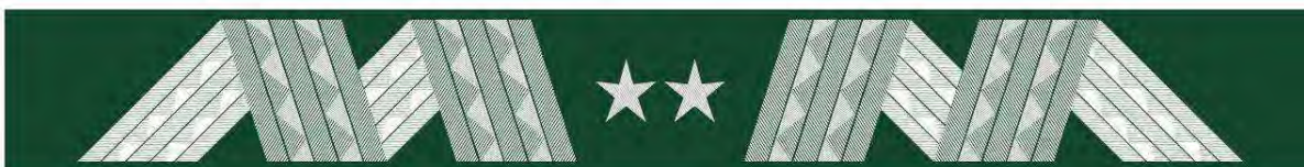
generał – otok kapelusza mundurowego