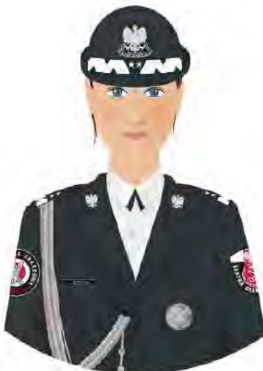
Kurtka mundurowa damska funkcjonariusza w stopniu generała z wizerunkiem orła białego na wylogach.