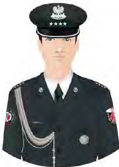
Kurtka mundurowa męska funkcjonariusza ze znakiem Krajowej Administracji Skarbowej na wyłogach.