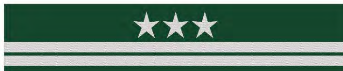
inspektor – otok kapelusza mundurowego