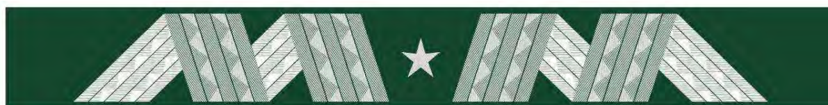
nadinspektor – otok kapelusza mundurowego