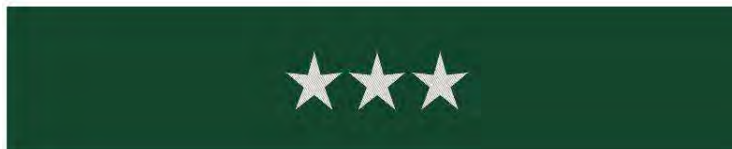
inspektor – otok czapki wyjściowej