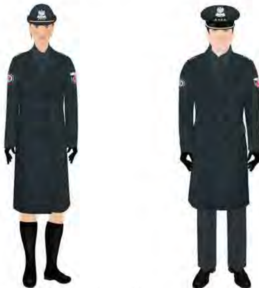
Funkcjonariusz ubrany w płaszcz.