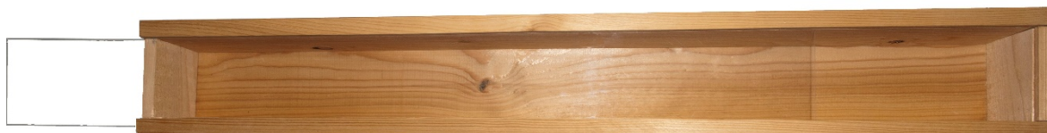
Rysunek nr 1