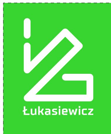
wariant monochromatyczny zielony Pantone 802 C – negatyw