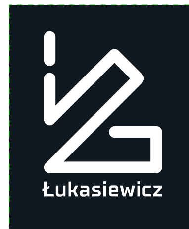
wariant monochromatyczny czarny Pantone Black 6 C – negatyw