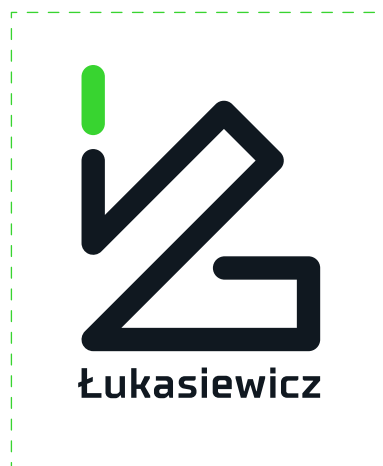
podstawowe tło – białe

Podstawowym tłem znaku jest kolor biały, a kolorem uzupełniającym czarny.