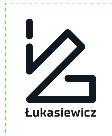
wariant monochromatyczny czarny Pantone Black 6 C – pozytyw