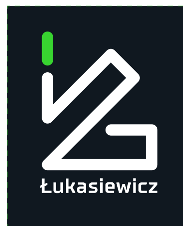
uzupełniające tło – czarne