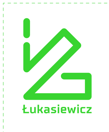
wariant monochromatyczny zielony Pantone 802 C – pozytyw

Warianty monochromatyczne znaku mają zastosowanie w tych obszarach komunikacji programu, gdzie wykorzystanie wersji pełnokolorowej jest niemożliwe ze względów technologicznych.