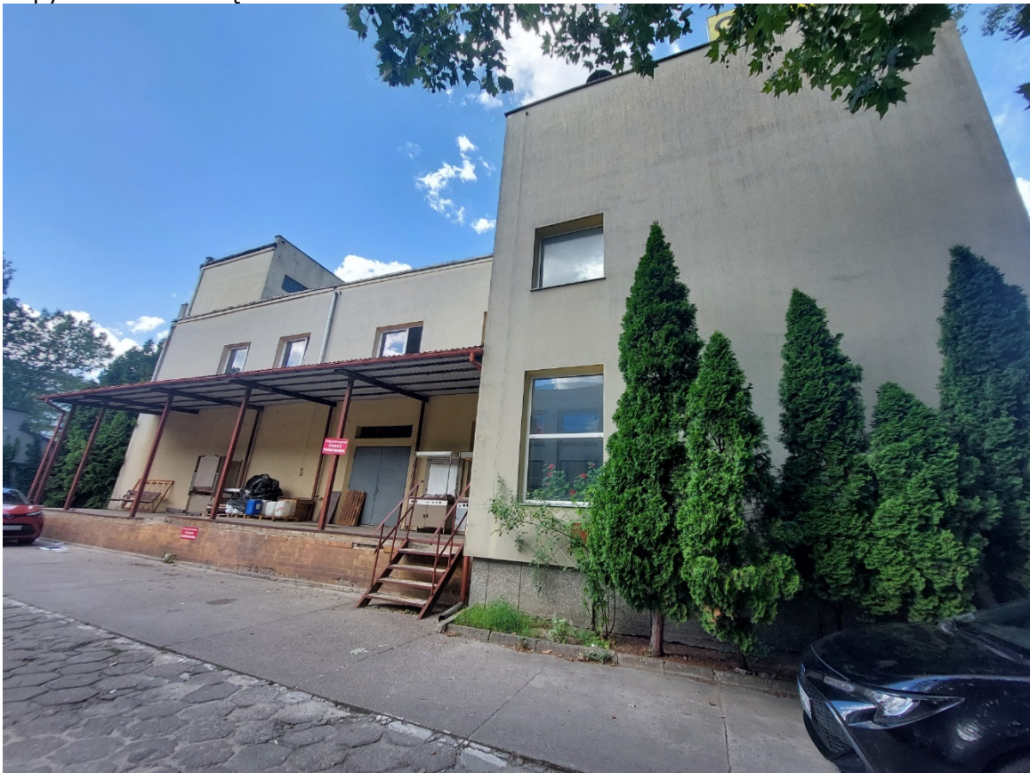
Fot 3 widok elewacji południowej budynku nr 9