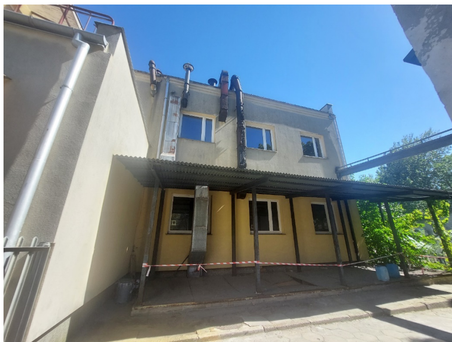
Fot.1 widok elewacji północnej - na dole osadniki - zaprojektować nowe klapy zamykające osadniki

Budynek ma część nad wjazdem do piwnicy - wiszącą przybudówkę. Przybudówka nie koliduje z planowanym fundamentem pod odpylacz i chłodnicę, ale ogranicza miejsce. Należy wziąć to pod uwagę planując wymiary fundamentu. Po północnej stronie budynku znajdują się w ziemi osadniki, na których nie można nic ustawiać, należy jednak zaprojektować odpowiednie klapy na osadniki.