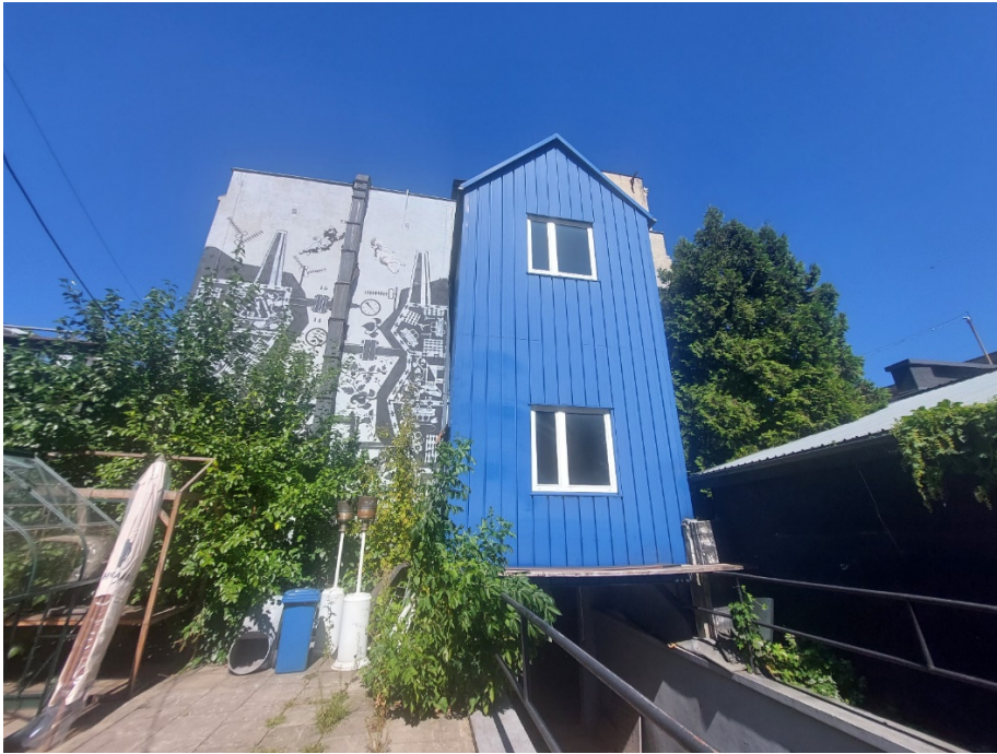
Fot 2 wisząca nadbudówka, z jej lewej strony ma być posadowiony fundament pod odpylacz i chłodnicę