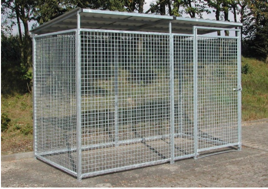
Fot nr 3 - przykładowa wiata na butle z gazem na fundamencie Rysunek poniżej przedstawia pomieszczenia parteru, zaznaczone będzie remontowane.