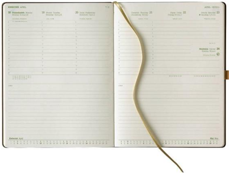
Rysunek 1 Zdjęcie poglądowe kalendarza