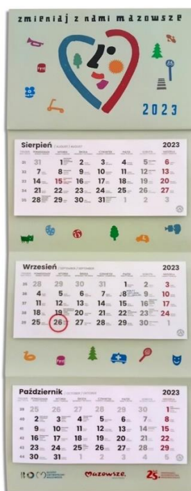
Rysunek 3 Zdjęcie poglądowe kalendarza z przykładową grafiką promującą BOM