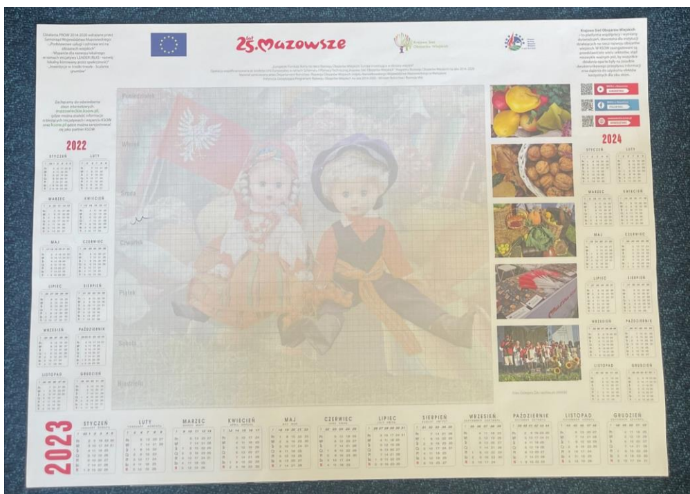
Rysunek 4 Zdjęcie poglądowe kalendarza biurkowego