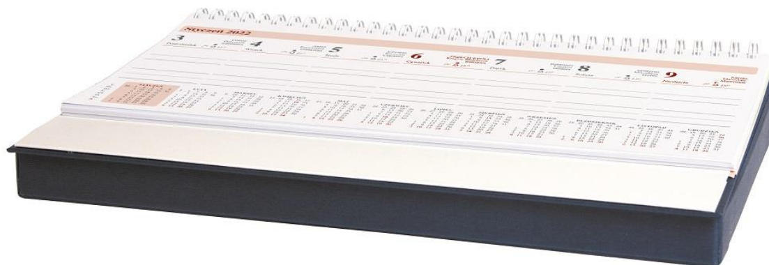
Rysunek 5. Zdjęcie poglądowe kalendarza biurkowego z piórnikiem