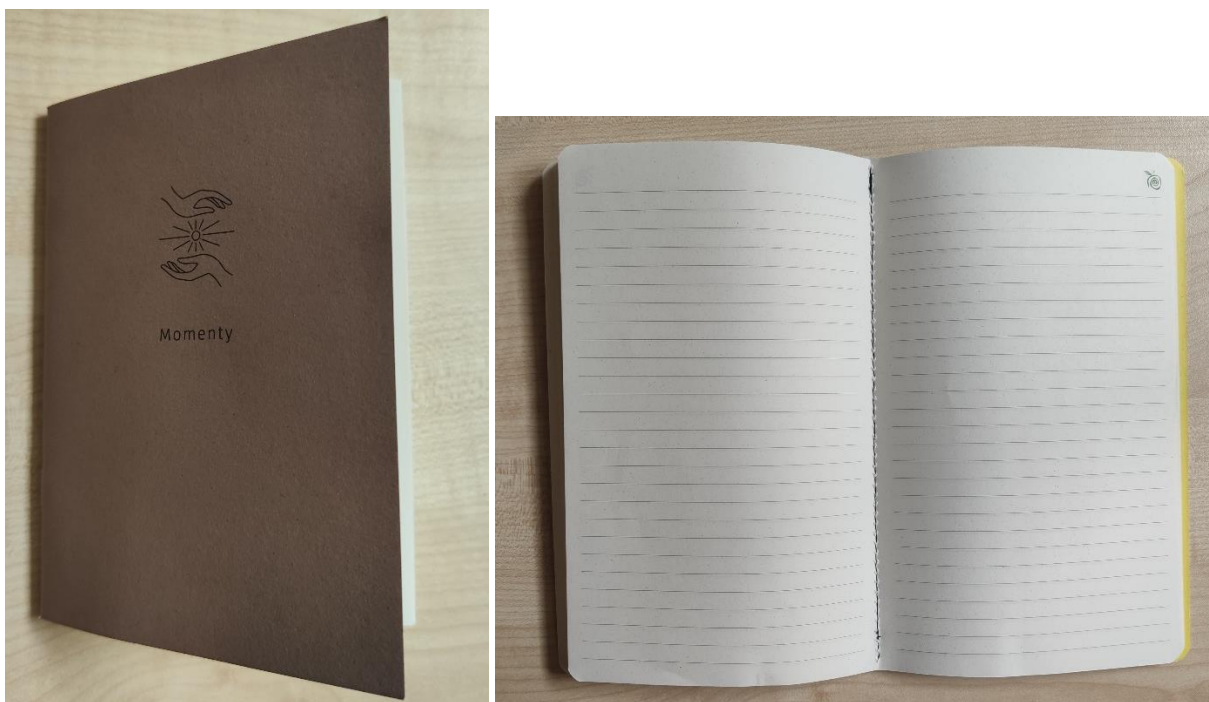
Rysunek 6. Zdjęcie poglądowe notatnika