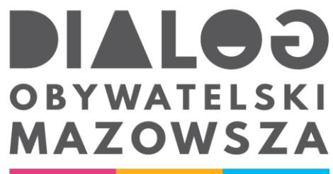
Rysunek 9 Logo BOM.