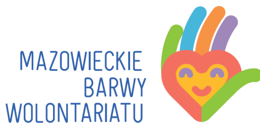
Rysunek 10 Logo Mazowieckiego Barwy Wolontariatu.