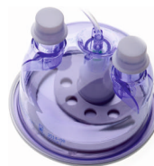
Komory nawilżacza do wszystkich typów wentylacji