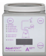
Nawilżacz, który godnie zastąpi Twój dotychczasowy