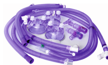
Układy pacjenta (wszystkie typy)