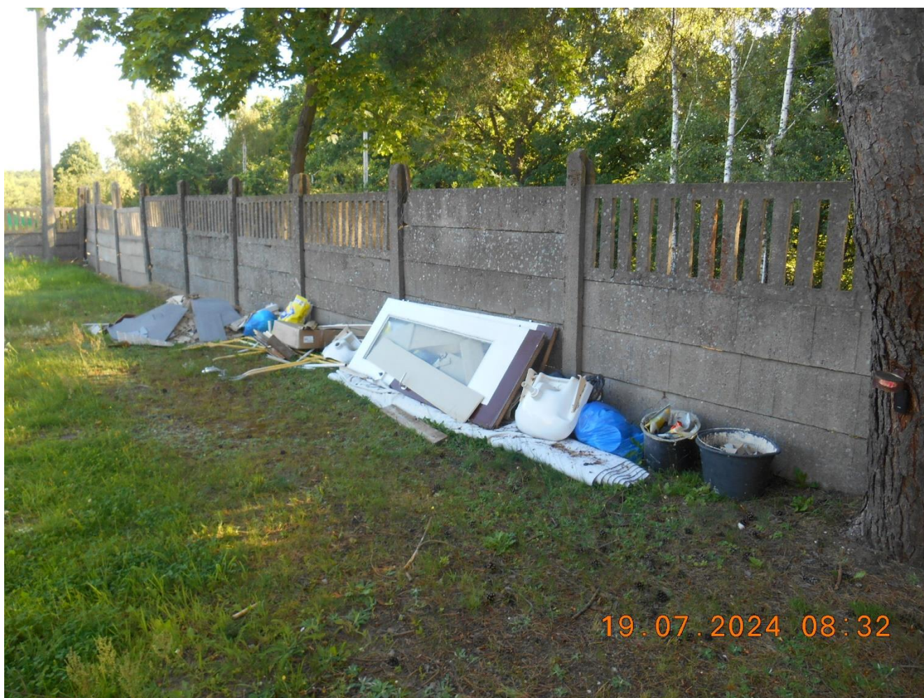
Zdjęcie materiałów do utylizacji

W oferowanej cenie za wykonanie poszczególnych elementów zamówienia trzeba ująć wszystkie niezbędne koszty do jego realizacji między innymi materiałów, robocizny, dojazdów itp.