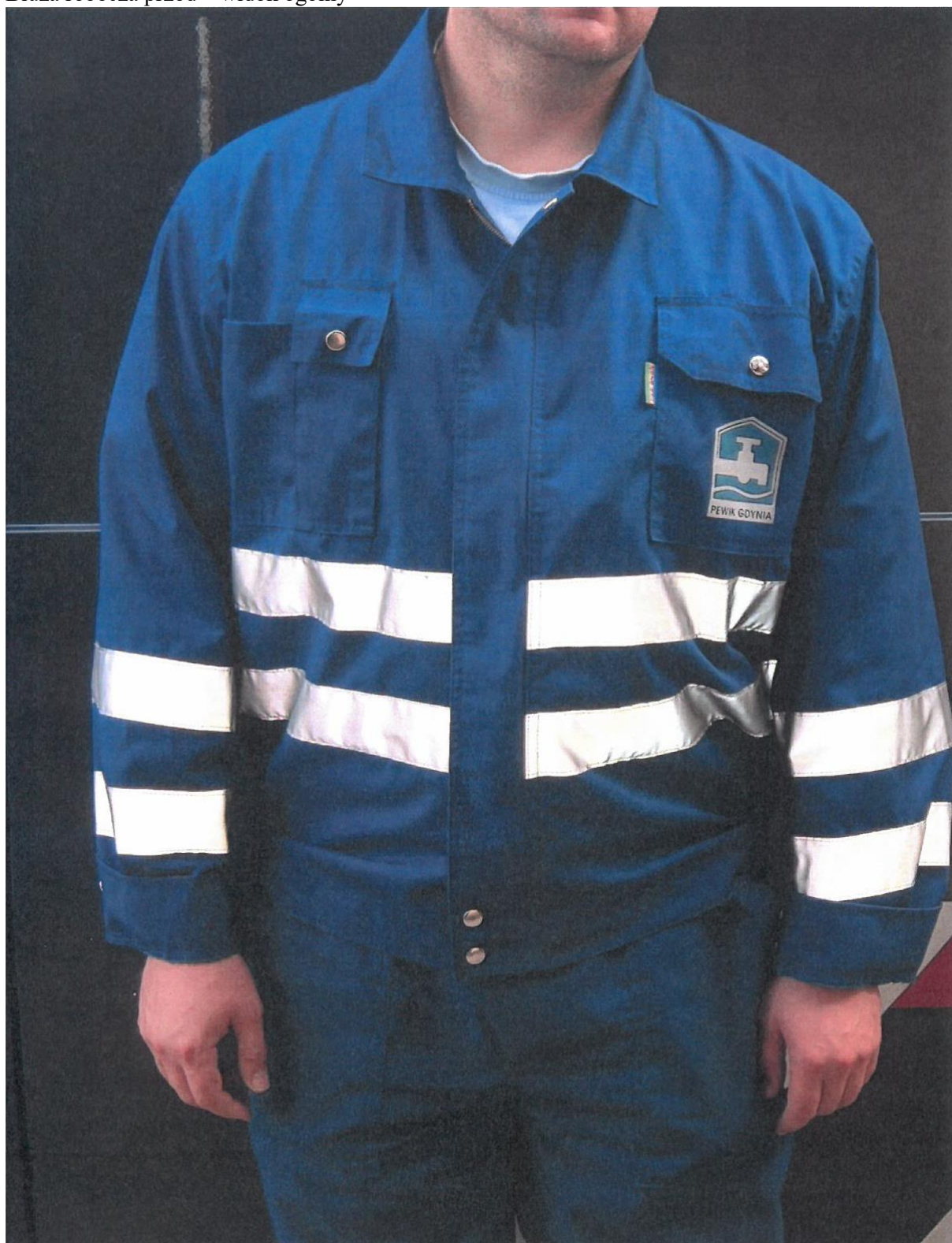
Bluza robocza przód – widok ogólny

Logo umieszczone z lewej strony (na sercu), zamek bluzy metalowy, zasłonięty listwą krytą zamykany na zatrzaski metalowe, kieszonka na telefon umieszczona z prawej strony.