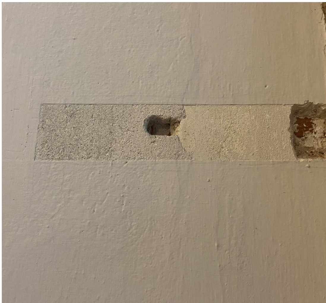
Rysunek 4 Fragment odkrywki wykonanej na początku XXI w. w pomieszczeniu kancelarii, którą należy powiększyć.