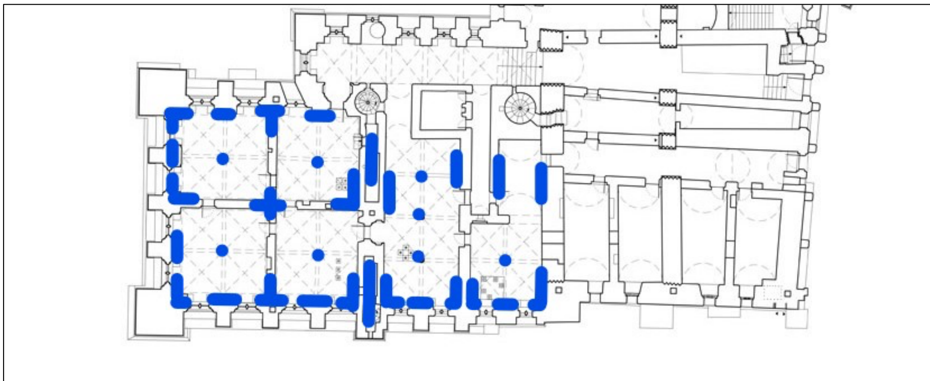
Rysunek 2 Rzut pomieszczeń Kancelarii Wielkich Mistrzów z lokalizacją planowanych miejsc wykonania odkrywek- badań stratygraficznych