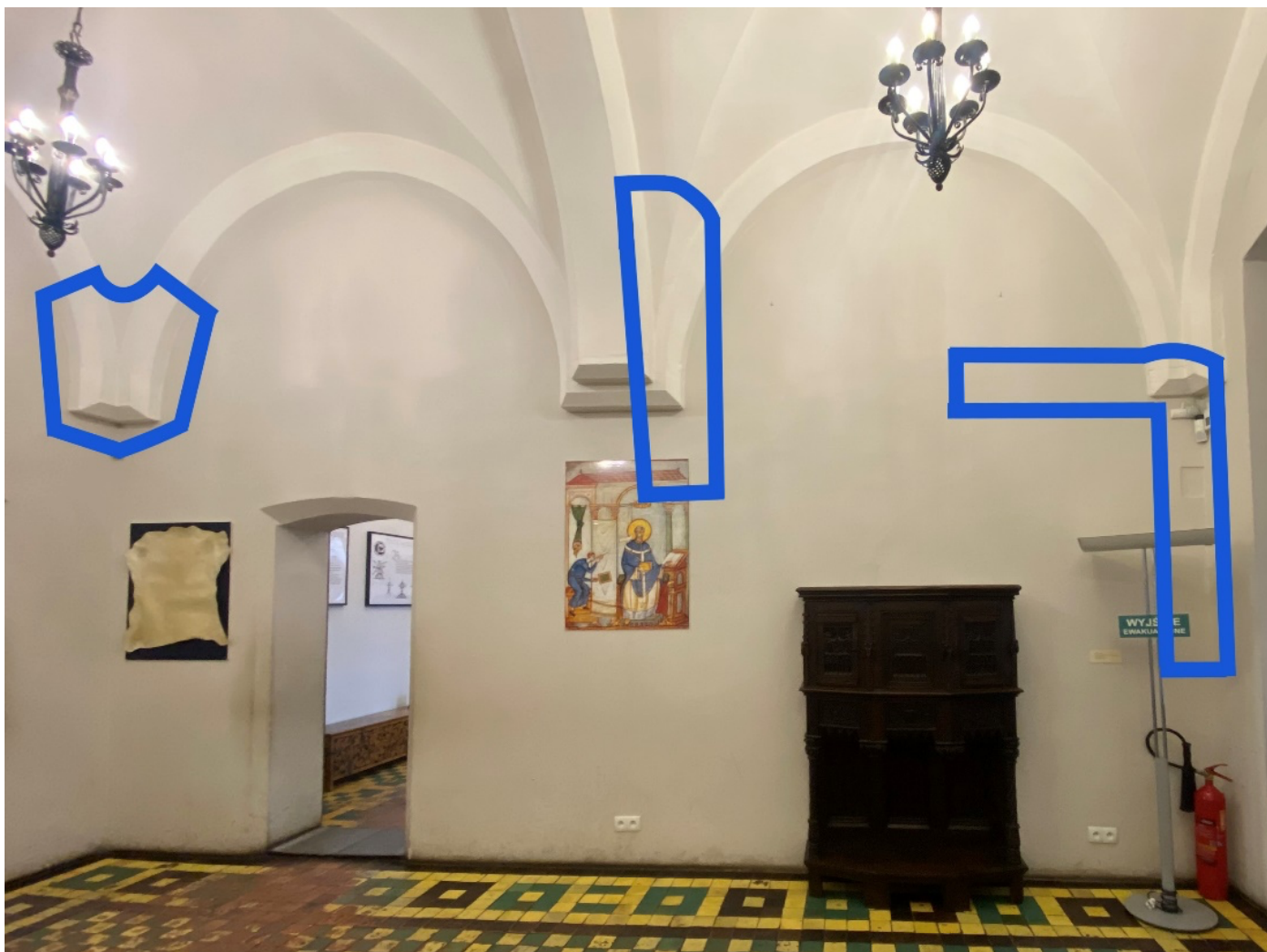
Rysunek 4 Przykładowe obszary do wykonania odkrywek