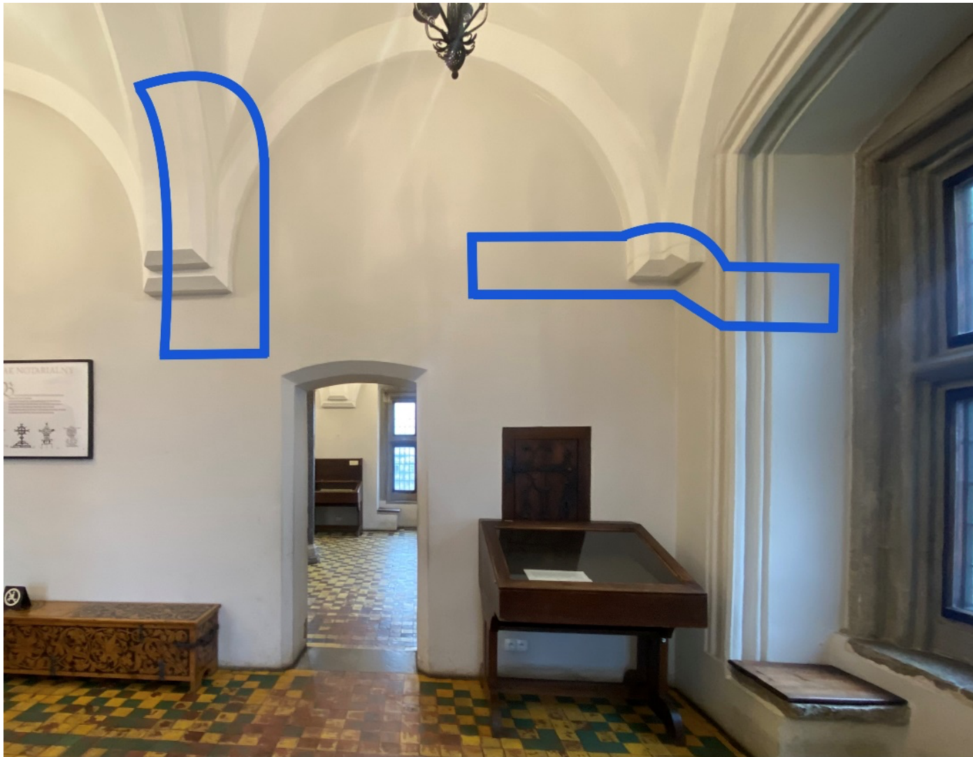
Rysunek 3 Przykładowe obszary do wykonania odkrywek