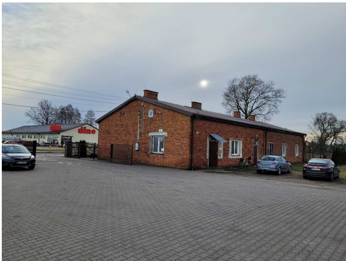
Zespół szkół nr 4 - Budynek Biblioteki i Przedszkola – rozdzielnica główna