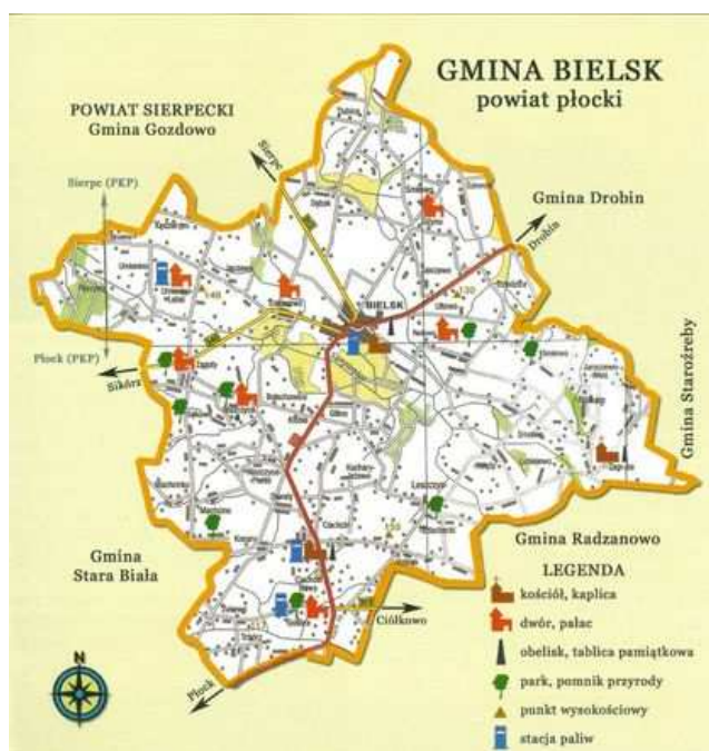
mapa Gminy Bielsk

Niniejszy program funkcjonalno-użytkowy opisuje wymagania i oczekiwania Zamawiającego stawiane przedmiotowej inwestycji.