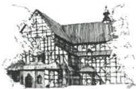
Kościół Pokoju pw. Św. Trójcy Wpisywany na listę UNESCO