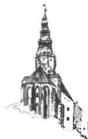
Kościół pw. Św. Stanisława i Św. Wacława Katedra Diecezji Świdnickiej