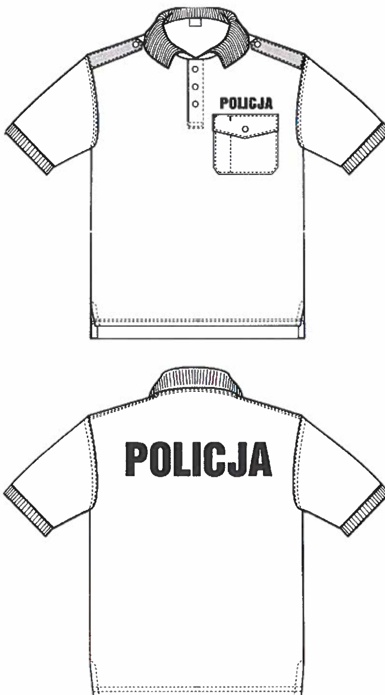
Rys. 1. Rysunek modelowy koszulki polo z krótkim rękawem w kolorze białym – widok z przodu i z tyłu.

Widok ogólny koszulki polo z krótkim rękawem przedstawia rysunek 1.