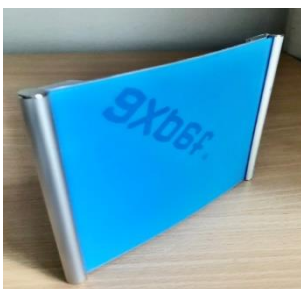
Zdjęcie nr 2. Zdjęcie poglądowe tabliczki - awers

Zdjęcie nr 1. przedstawia rewers tabliczki imiennej. Tabliczka ustawiona jest pionowo.