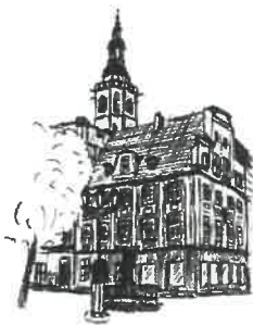
Rynek Wleza ratuszowa