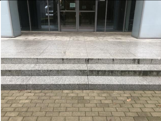
Fot. 4. Schody wejściowe od frontu budynku