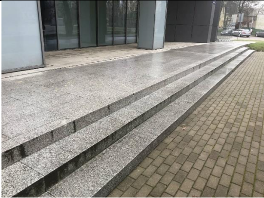
Fot. 2. Schody wejściowe od frontu budynku