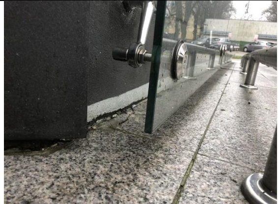
Fot. 5. Szyby na elewacji budynku