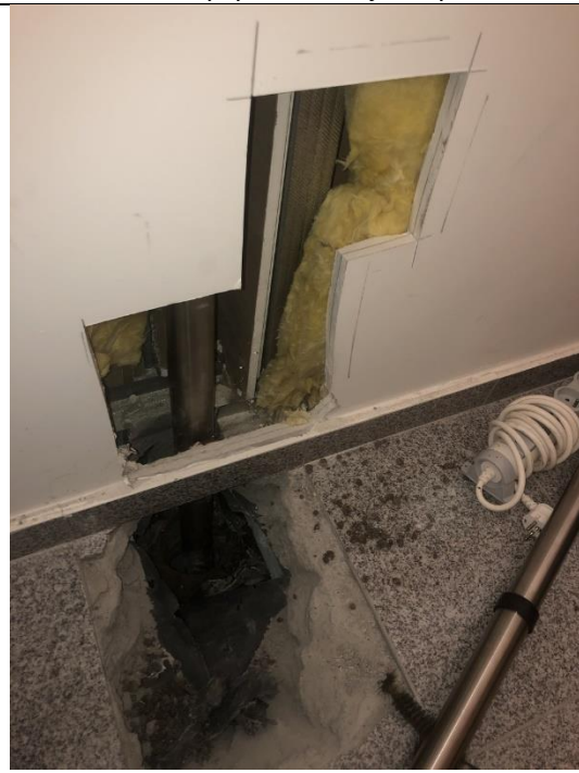
Fot. 7. Odkrywka obrazująca zalanie w pom. 0.19