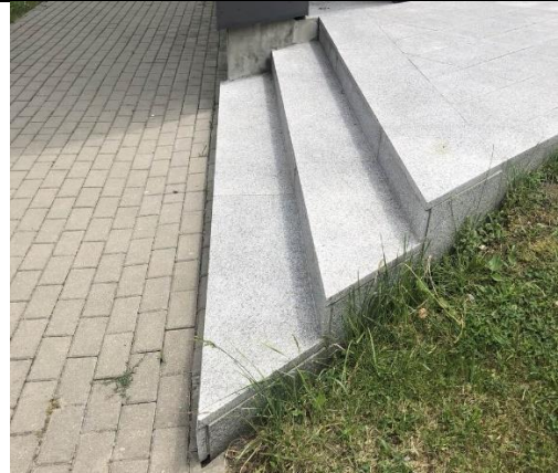
Fot. 3. Schody wejściowe od frontu budynku