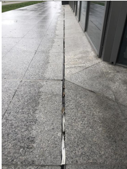
Fot. 6. Widoczne wybrakowania dylatacji