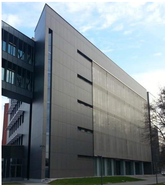
Fot. 1. Widok główny budynku

Budynek Interdyscyplinarnego Centrum Badań Naukowych zlokalizowany na kampusie Katolickiego Uniwersytetu Lubelskiego przy ul. Konstantynów 1J w Lublinie. Budynek średnio-wysoki o pięciu kondygnacjach nadziemnych i jednej podziemnej.