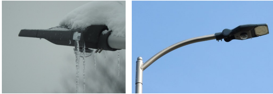
Fot. Prawidłowy montaż urządzeń sterujących od dołu korpusu oprawy

Dodatkowo urządzenia automatyki sterującej muszą być wyposażone w czujnik pomiaru natężenia światła zewnętrznego, które w przypadku montażu na górze korpusu oprawy i opadów śniegu w okresie zimowy, mogą zostać przykryte przez śnieg. Przykrycie czujnika pomiaru natężenia światła zewnętrznego przez śnieg będzie wprowadzać automatykę sterującą w nieprawidłowe działanie, przekazywać nieprawidłowe pomiary natężenia światła zewnętrznego i załączać oprawy poza okresem nocnym.