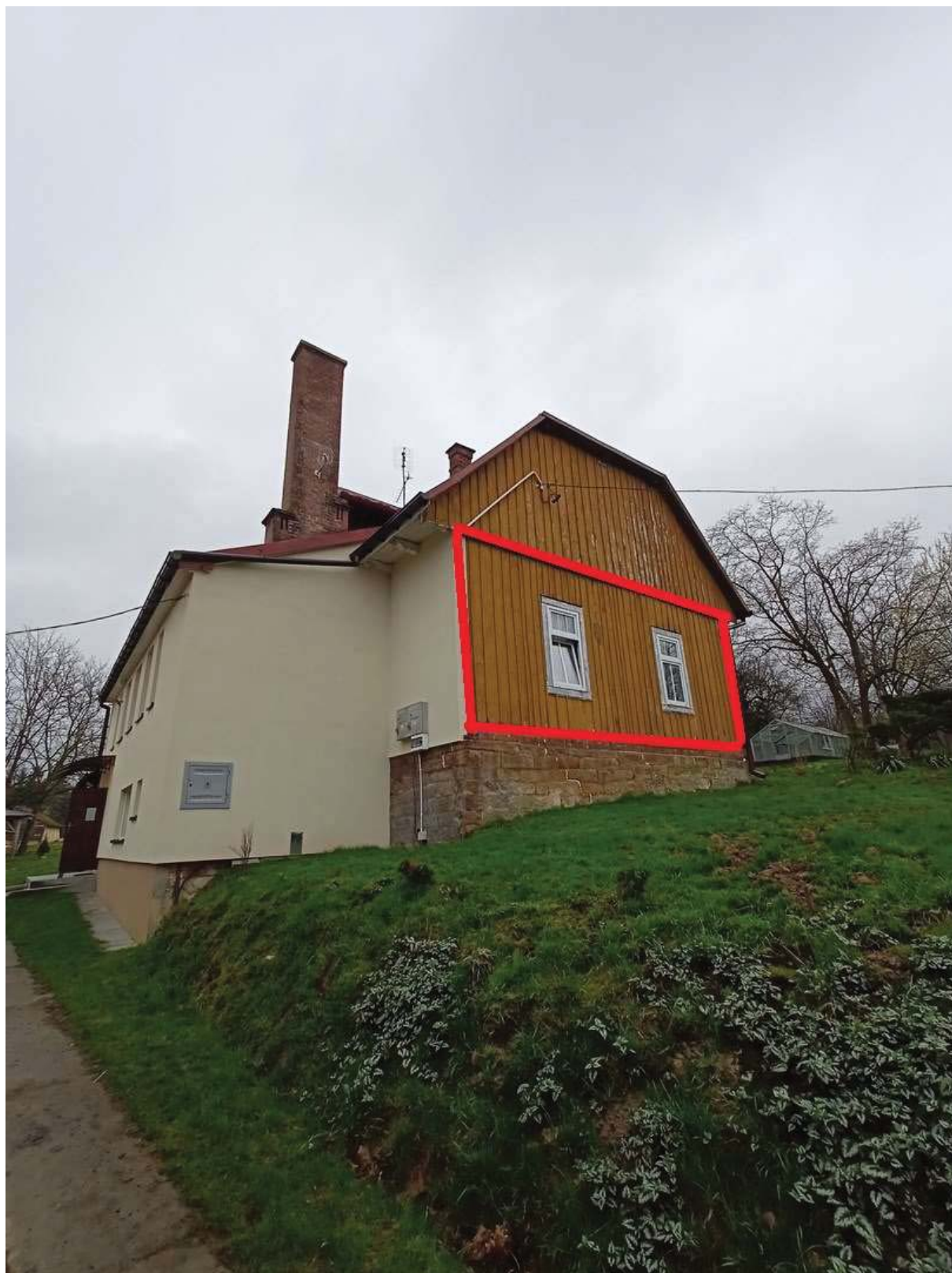
Rysunek 3 Zakres modernizacji – docieplenie ścian