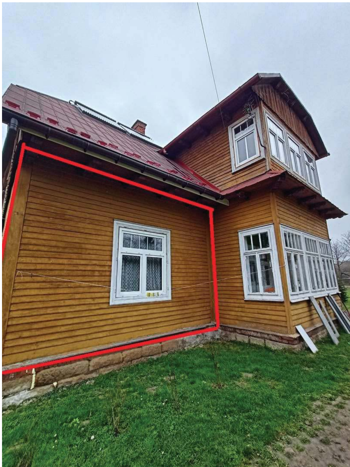
Rysunek 2 Zakres modernizacji – docieplenie ścian