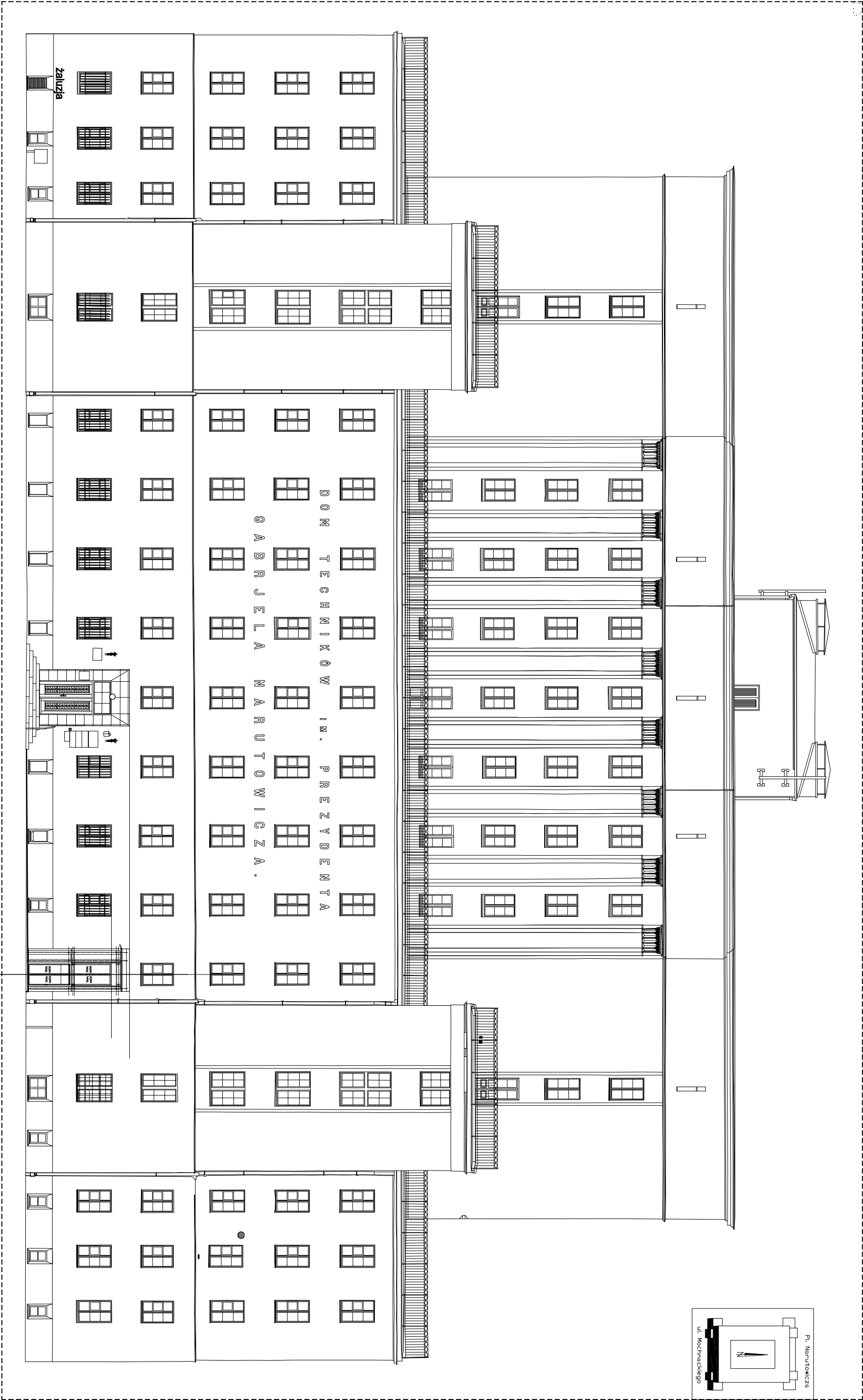
WIDOK OD STR. UL. MOCHNICKIEGO