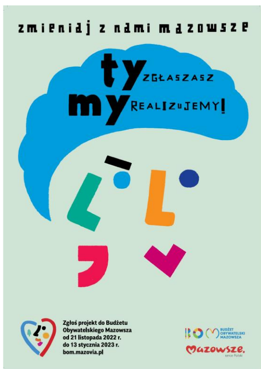
Rysunek 2 Ulotka 1 strona