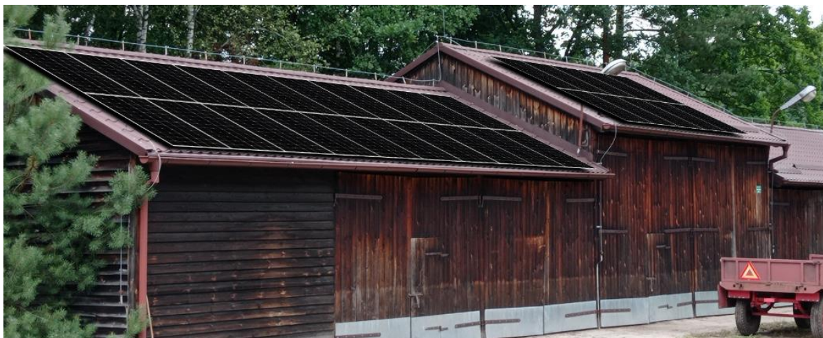
Rysunek nr 3. Lokalizacja paneli fotowoltaicznych na dachu stodoły (szopy) Szkołki leśnej Listewka

2. Nazwy i kody dotyczące przedmiotu zamówienia określone we Wspólnym Słowniku Zamówień Publicznych (CPV):