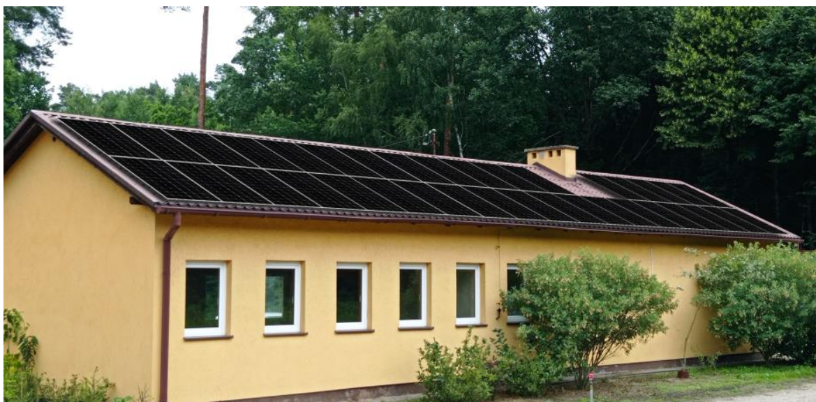
Rysunek nr 2. Lokalizacja paneli fotowoltaicznych na dachu budynku administracyjno-socjalnym Szkółki leśnej Listewka