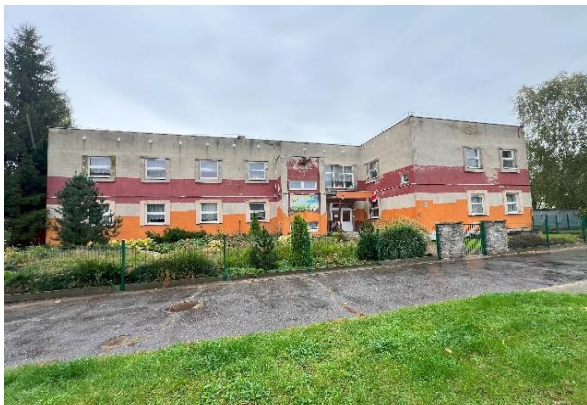
fot. 1 - widok obiektu elewacja północna