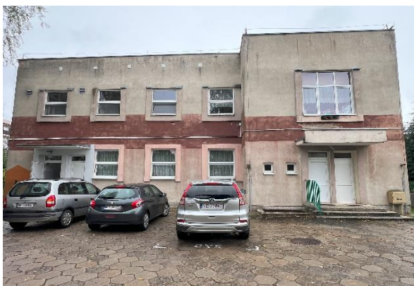
fot. 2 - widok obiektu elewacja zachodnia