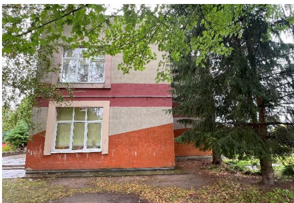
fot. 4 - widok obiektu elewacja wschodnia