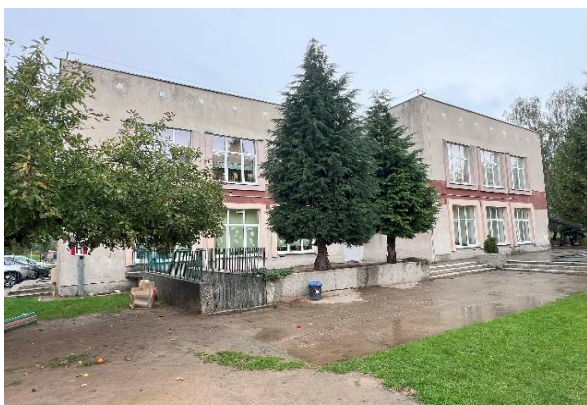
fot. 3 - widok obiektu elewacja południowa