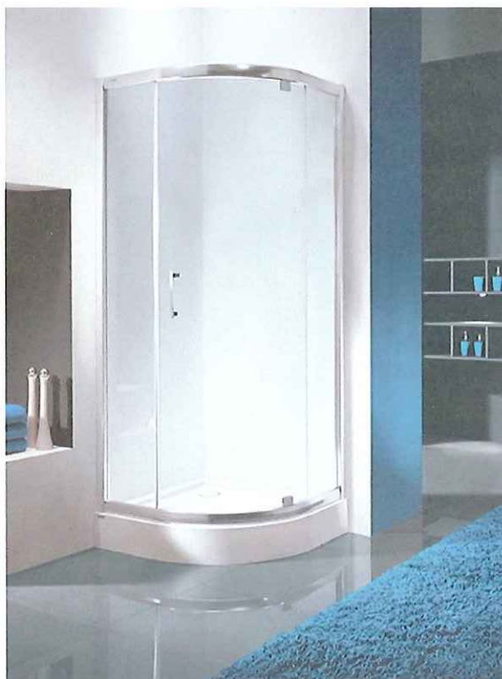
Wzór kabiny otwieranej (nie rozsuwanej)