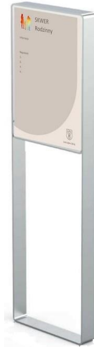
Fot. 2 Zdjęcie poglądowe tablicy regulaminu