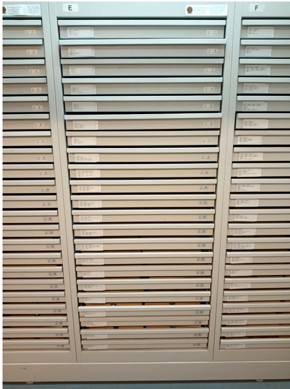
Zbliżenie pojedynczej sekcji – zdjęcie poglądowe