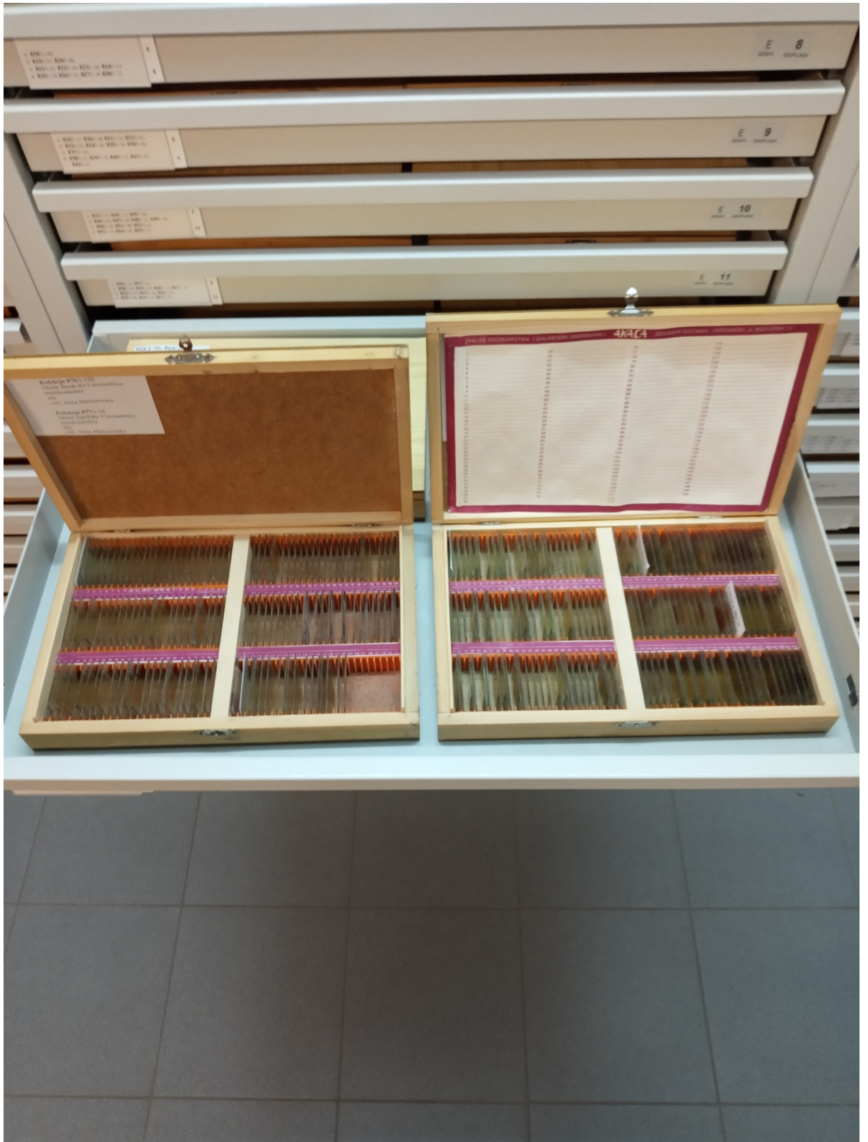
Kasetki na szlify (płytki cienkie, o wymiarach 48 x 28 mm – zdjęcie poglądowe