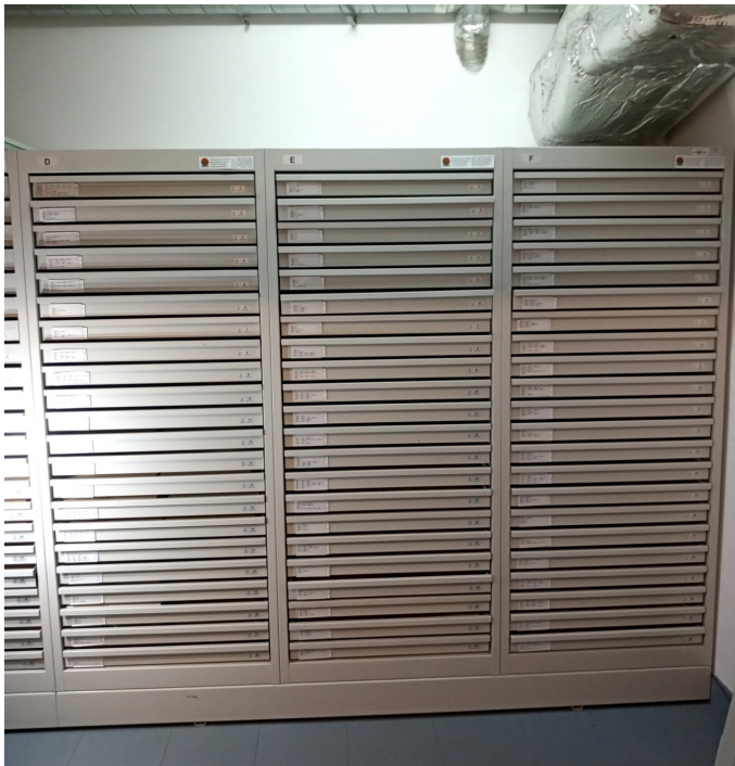
Szafa do przechowywania szlifów (3 sekcje na wspólnej podstawie) – zdjęcie poglądowe

Poniżej przedstawiamy poglądowe zdjęcia obecnie używanych szaf do przechowywania szlifów (płytek cienkich) oraz kasetek i klaserów: