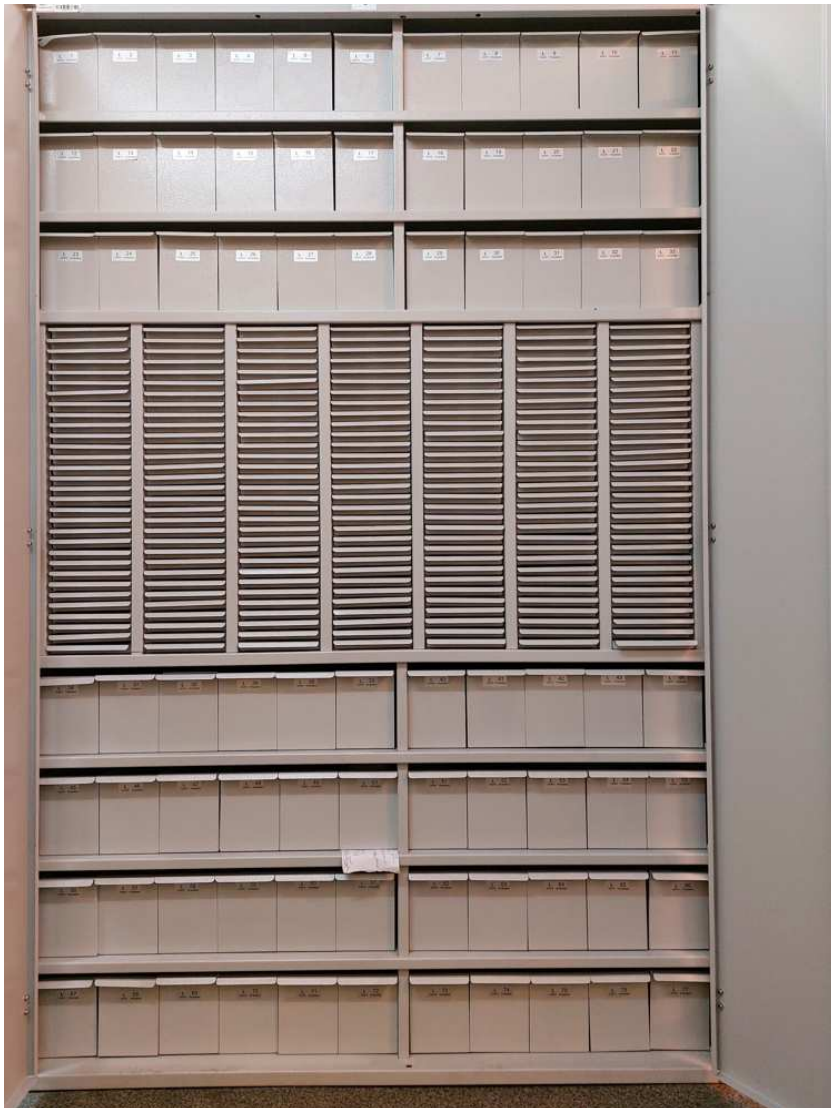
Szafa do przechowywania próbek mikropaleontologicznych – widok wnętrza (zdjęcie pogładowe)