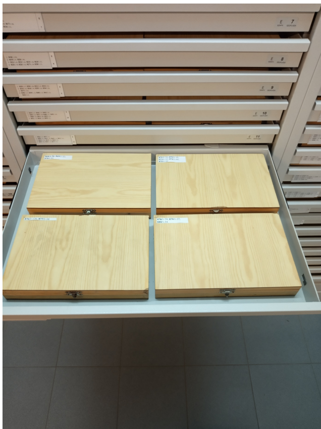
Szuflada z kasetkami na szlify (płytki cienkie) – zdjęcie poglądowe