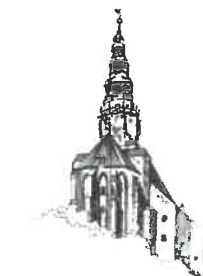
Kościół pw. Św. Stanisława i Św. Wacława Katedra Diecezji Świdnickiej

Dotyczy: postępowania nr P-78/VIII/24 o udzielenie zamówienia publicznego obejmującego zadanie pn.: „Termomodernizacja budynków Gminy Miasto Świdnica pełniących funkcje oświatowe: budynku A i C Szkoły Podstawowej nr 4 w Świdnicy przy ul. Marcinkowskiego 4-6”