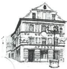
Kamianica „Pod Bykami”